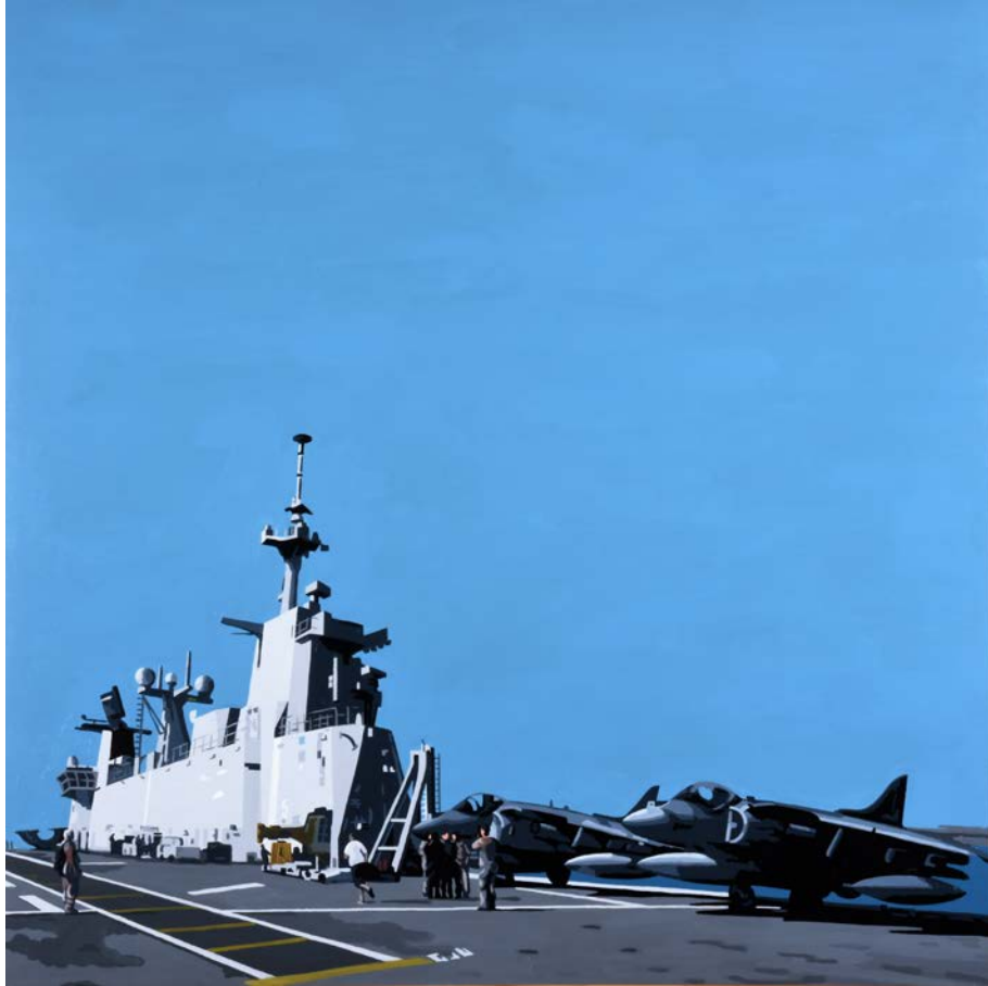
En cubierta II