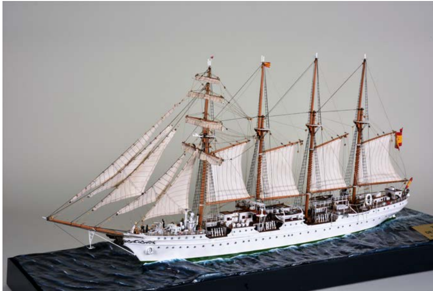
Tradición de honor y viento Buque escuela Juan Sebastián de Elcano Armada Española