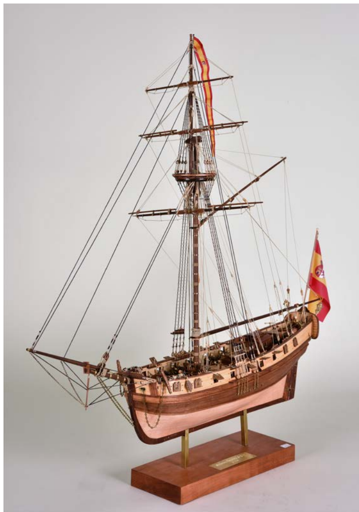
Balandra española Valenzuela , s. XVIII