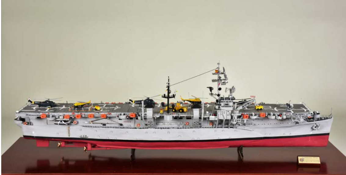
Portaeronaes Dédalo (R01)