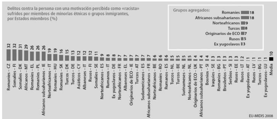
Delitos de racismo. (Informe RAXEN, 2012)).

Recibe el calificativo de racismo cualquier actitud, conducta o manifestación académica, política, cultural o social que suponga afirmar o reconocer de forma explícita o implícita, tanto la inferioridad de algunos colectivos étnicos como la superioridad del colectivo propio. También, la justificación de la diferencia racial es ya una expresión de racismo, pues el uso del concepto de RAZA, muy antiguo en la cultura occidental, carece de sentido como afirman la biología molecular y la genética de poblaciones. El racismo adopta formas diversas en distintos países, en función de la historia, cultura u otros factores sociales, aunque como nexo común suele conllevar discriminación, segregación social, rechazo a la cultura y a los valores ajenos, practicando abiertamente el hostigamiento o violencia hacia la víctima o su colectivo, mostrando en el esclavismo, el holocausto, el apartheid o la limpieza étnica sus expresiones más criminales.