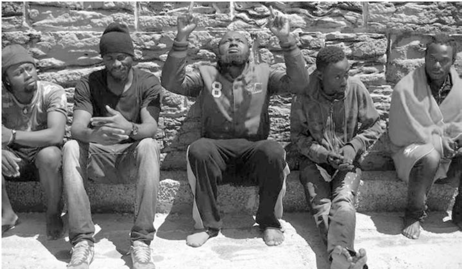
Grupo de inmigrantes irregulares en una playa española tras haber sido rescatados por Salvamento Marítimo.

Asimismo, son de destacar las operaciones desarrolladas en aguas africanas en las que interviene la Armada, ya comentadas con anterioridad, encaminadas a defender los intereses marítimos (5) y cooperar con los países de la zona en operaciones encaminadas a mejorar la seguridad marítima, y luchar contra la piratería (6), el contrabando, el tráfico de estupefacientes, el tráfico