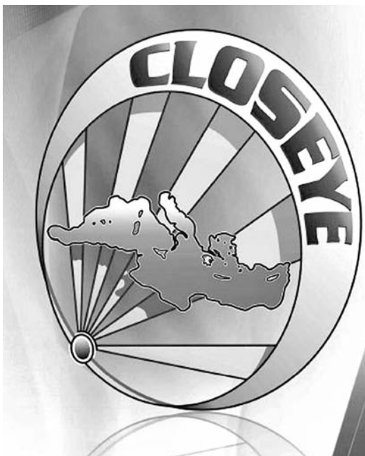
Emblema del proyecto «Closeye».

Está en desarrollo el proyecto PERSEUS (Protection of European Borders and Seas through the Intelligent Use of Surveillance), liderado por INDRA. Es un sistema europeo de vigilancia, para la protección de los mares europeos y sus fronteras, mediante la integración de los sistemas de vigilancia y control de fronteras marítimas europeas y nacionales existentes en la actualidad. El proyecto, patrocinado por la UE con un presupuesto de 43,7 millones de euros y una duración de cuatro años, será el más importante dentro del área de seguridad marítima, y está siendo desarrollado por un