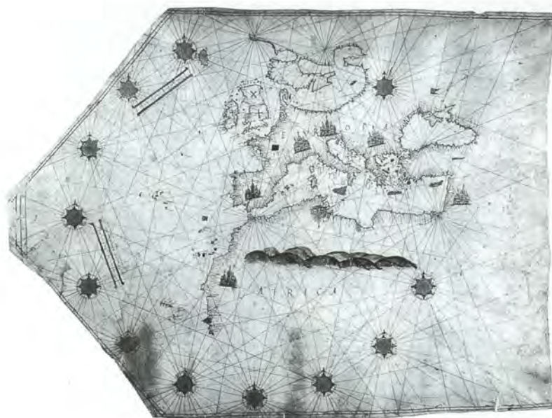
Portulano del Mediterráneo de Juan Vespuci. Sevilla 1526. Original en Archivo de Indias.

Las escasas informaciones de este continente, anteriores a las de los portugueses, provenían de los mapas de Ptolomeo. Las fuentes del Nilo, que no se descubrieron hasta el siglo XIX, admitían toda suerte de interpretaciones. El río Congo en su curso hasta el mar, salía de un lago interior que también le suministraba agua al Nilo y a un tercer brazo o río que desembocaba en el sudoeste de la costa de África. En la carta de Juan de la Cosa el contorno de África está muy bien diseñado pues tiene su orientación norte sur a diferencia de otras cartas anteriores que aparece con inclinación noroeste-sudoeste ya que Ptolomeo la concebía como formando parte de Asia para hacer del Índico un mar cerrado.