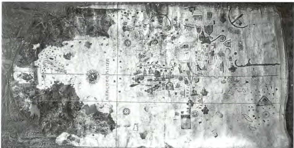
Carta universal de Juan de la Cosa. 1500. Original en el Museo Naval.

La carta de Juan de la Cosa, que se encuentra en el Museo Naval de Madrid, Inv-257 es una carta manuscrita, con colores dibujada en dos pieles de pergamino unidas que miden en total 93 milímetros de alto por 183 milímetros de ancho, tiene tamaño irregular ya que la parte izquierda es el cuello del animal, en este caso parece piel de ternera. Es también una carta portulana tradicional a la que se le han añadido las tierras recién descubiertas. Está dibujada sobre dos trozos de pergamino pegados por el centro, cuya unión pasa por Italia y África. El pergamini-