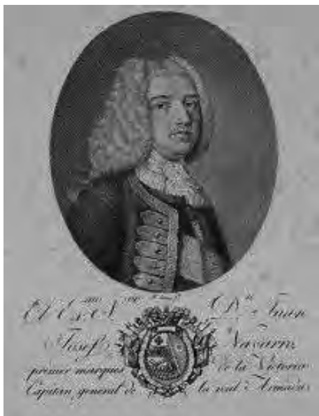
Don Juan José Navarro por Fernando Selma (1752-1810)