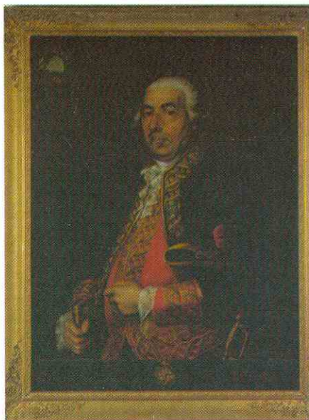
Antonio Barceló (1717-1797), teniente general de la Real Armada, que izó su insignia en el Terrible durante el bombardeo de Argel (agosto de 1783). (Óleo anónimo, Museo Naval de Madrid, núm. inv. 466.)