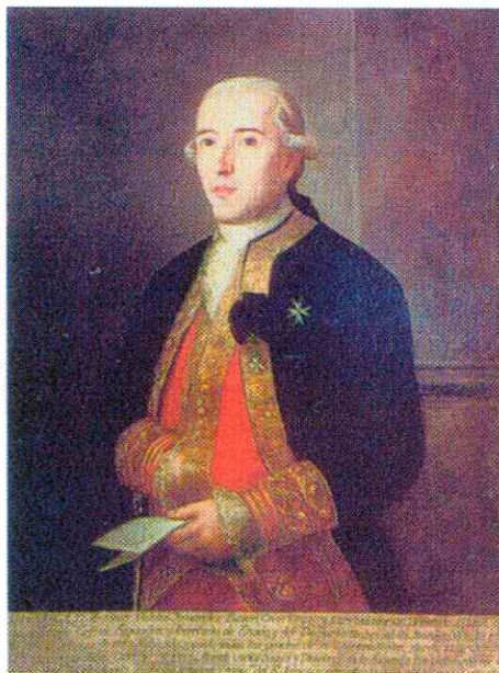
El secretario de Estado de Marina Antonio Valdés (1744-1816). Óleo sobre lienzo de autor anónimo, 113 x 84 cm (Museo Naval, Madrid, núm. inv. 416).

El informe y observaciones, en relación con las listas remitidas desde los departamentos marítimos, fue el siguiente (31):