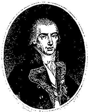
Retrato del Capitán General Gravina en su uniforme de mar, con la insignia de su Real Armada de 1806, grabado en el original de la colección de la Real Armada.