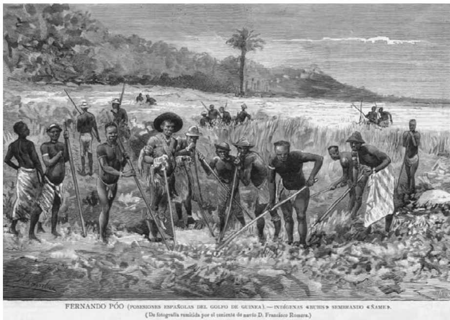
Grabado de bubis plantando ñame. La Ilustración Española y Americana , 30 de agosto de 1883, dibujado de la fotografía realizada por el teniente de navío Romera

aparecen formulados en el catálogo de la exposición colonial en Ámsterdam, con la pretensión de desmentir la fama de insalubre del clima de la zona. En su expedición interior describió también la naturaleza, destacando el dominio de la flora sobre la fauna en la isla.