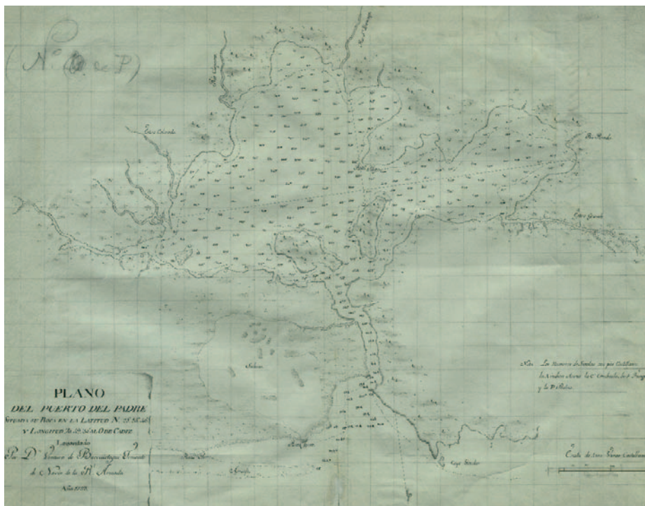
Plano de Puerto Padre, levantado por el teniente de navío Ventura de Barcáiztegui en 1793. sign. MN-19-B-8

Ardilla , y quedó asignada a los buques del apostadero 13 . Por entonces, la capital cubana y sus inmediaciones se encontraban bloqueadas por mar, y desde su costa podían divisarse bellos navíos de dos puentes.