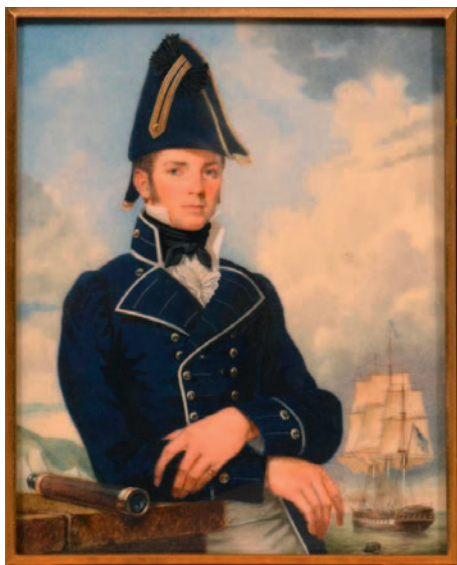
Retrato de un teniente de navío británico, con una corbeta en segundo plano, realizado en el año 1805. Miniatura. Colección privada

arribó a Puerto Rico,, donde desembarcó al 3. er batallón del Regimiento de Infantería de África.