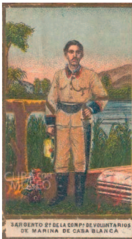
Ilustración 7. Detalle del uniforme de campaña de un sargento 2.º de la Compañía de Voluntarios de Marina de Casa Blanca

La orden general del Ejército del 13 del mismo mes recoge otra mención de la unidad. En esa fecha tuvo lugar una gran parada en la que la infanta Eulalia revistó a las fuerzas acantonadas en La Habana. Entre ellas se encon-