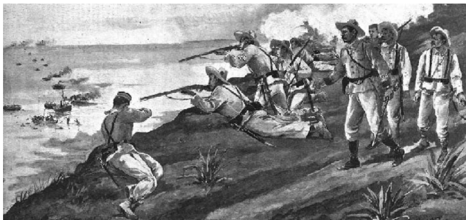
Ilustración 9. Guerrillas españolas rechazando el desembarco de las tropas norteamericanas en la costa de Cienfuegos (Cuba). Dibujo de La Ilustración Española y Americana , 22 de mayo de 1898