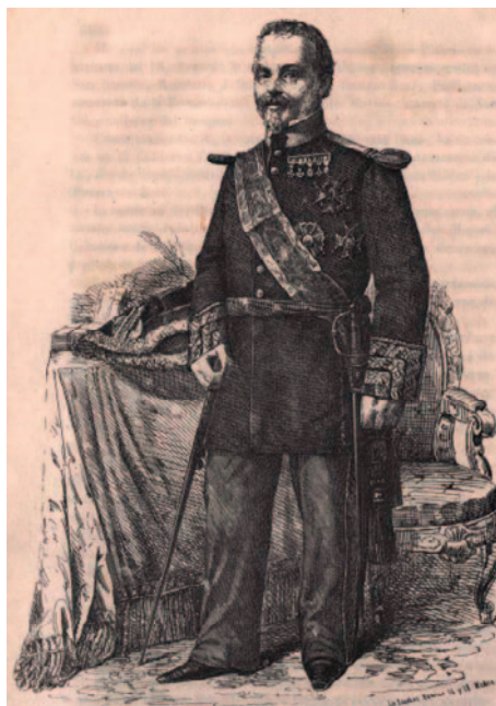
Ilustración 1. Teniente general Evaristo Fernández de San Miguel, inspector general de la Milicia Nacional. Historia de la Milicia Nacional , Madrid, 1855

La milicia, bajo cualquiera de sus acepciones, durante el reinado de Isabel II y a lo largo de gran parte del siglo XIX, fue una continua fuente de conflictos entre los partidos liberal moderado y liberal progresista; así, en 1844, tras