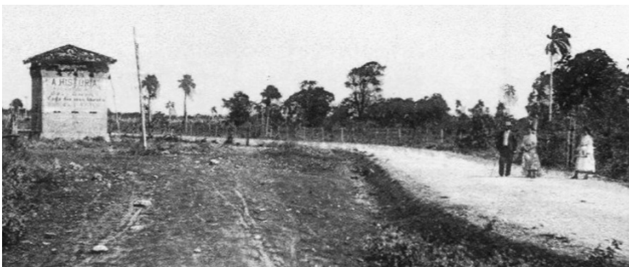
Ilustración 11. Carretera de Caibarién a Remedios. A la izquierda de la imagen se observa el fortín de Rojas, posición defensiva española a la entrada de la ciudad.

mando del 1. er teniente Lastra, embarcaría en las lanchas de la Armada Cauto y Valiente 62 para controlar la navegación en los esteros de Morón, donde los insurgentes mantenían presencia. Este servicio se repetiría en septiembre, esta vez sobre la costa de Yaguajay, al recibirse confidencia de un desembarco de armas para los mambises.