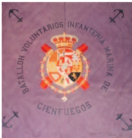
Ilustración 10. Bandera del Batallón de Voluntarios de Infantería de Marina de Cienfuegos.