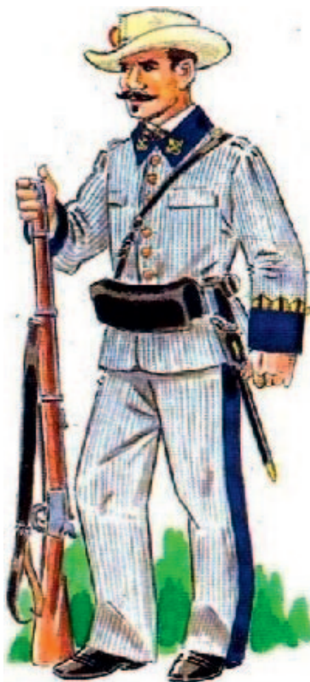
Ilustración 5. Uniforme de los efectivos de Infantería de Marina del Instituto de Voluntarios de la isla de Cuba, 1892. BUENO CARRERA, J.M. a : Uniformes militares españoles. La Infantería y la Artillería de Marina , 1985

En 1892, año de la publicación, como ha quedado dicho, del citado reglamento, en Cuba solo se encontraban constituidas, como unidades de voluntarios de Infantería de Marina, las Compañías de Casa Blanca 33 –que posteriormente formaron un tercio– y una sección en Batabanó, ambas en el territorio