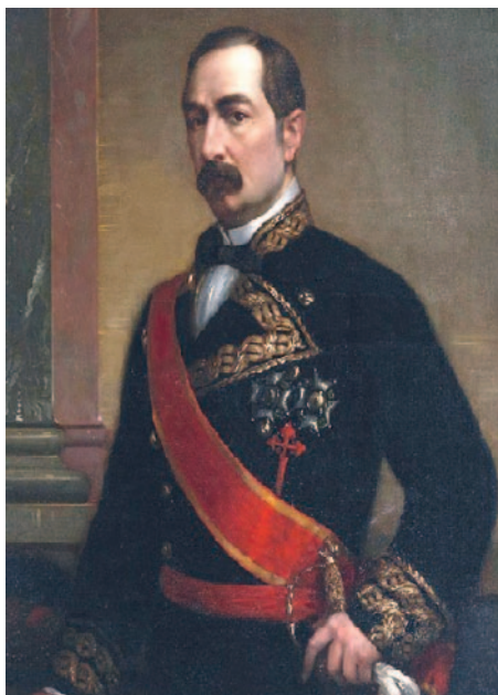
Ilustración 2. Óleo del teniente general José Gutiérrez de la Concha, obra de Rafael Díaz de Benjumea, 1886, Museo del Prado

Esa organización se mantendría, grosso modo , hasta 1850, cuando, bajo el gobierno del entonces capitán general de la isla, teniente general del Ejército Federico Roncali Ceruti, se crearon unas unidades, denominadas de «Nobles Vecinos» 16 , como fuerzas auxiliares del ejército regular allí desplegado. Tales unidades, junto a este, reforzaron las defensas de la isla contra los conatos de invasión que, instigados por Estados Unidos, se dieron en 1850 y 1851, cuando fuerzas mercenarias estadounidenses, provenientes principalmente de los estados del Sur, intentaron desembarcar en la ciudad de Cárdenas y en la provincia de Pinar del Río, respectivamente. Ambas intenciones estuvieron dirigidas por el antiguo militar venezolano Narciso López de Uriola, quien siendo coronel del Ejército español había combatido en las filas de este, primero contra los independentistas venezolanos y, posteriormente, en el bando isabelino durante la