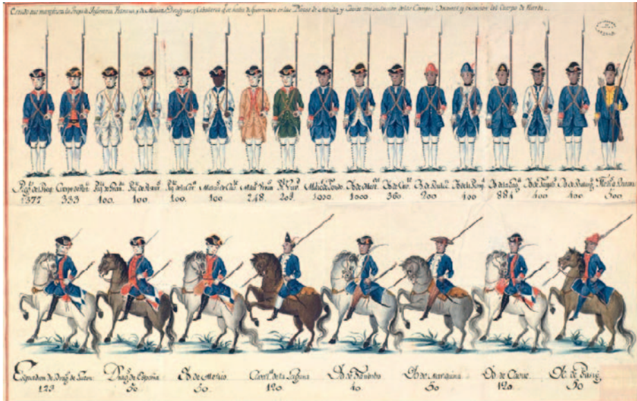
Ilustración 4. «Estado que manifiesta la Tropa de Ynfantería Veterana y de Milicias, Dragones Caballería que se halla de guarnición en las plazas de Manila y Cavite, con inclusión de los campos volantes y exclusión del cuerpo de reçerba» (1780). Archivo General de Indias, signatura MP-UNIFORMES, 61bis

colegio de San Juan de Letrán. Formada durante el mandato del gobernador Simón de Anda y Salazar (1770-1776), fue destinada a la guarnición del arsenal de Cavite 16 . A estas nuevas unidades habría que añadir una compañía suelta de malabares.