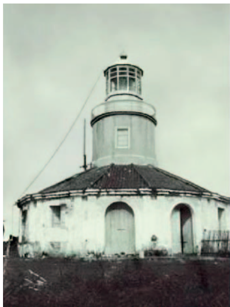
Ilustración 11. Faro de la isla de Corregidor. Patrimonio Nacional, carpeta Islas Filipinas, Obras Públicas, Faros (1893)

dad de europeos. En este sentido, el comandante general del apostadero de Filipinas y el jefe de las fuerzas de Infantería de Marina en el archipiélago consideraban que la reducción que nos ocupa traería «funestas consecuencias» en caso de darse una sublevación como la 1872, por lo que ambos insistirían en la urgencia de modificar el porcentaje de la plantilla indígena. Accediendo a esta solicitud, una real orden de 29 de mayo de 1878 (ib.: 1878, pp. 504-505) disponía el aumento de la plantilla de la 1. a compañía en cincuenta soldados europeos –la misma cantidad en que se había minorado el año anterior, al pasar destinados a la Compañía de Guardias de Arsenales–, que serían sorteados entre los de su clase pertenecientes a las fuerzas departamentales en la metrópoli. Al propio tiempo, se eliminaba el mismo número de efectivos de esa clase en el componente indígena de la 2. a compañía,