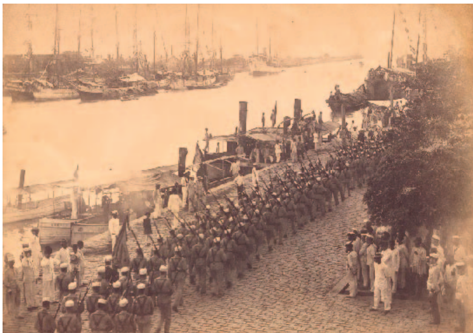
Ilustración 12. Llegada del Batallón Expedicionario a Manila y desfile por su puerto.