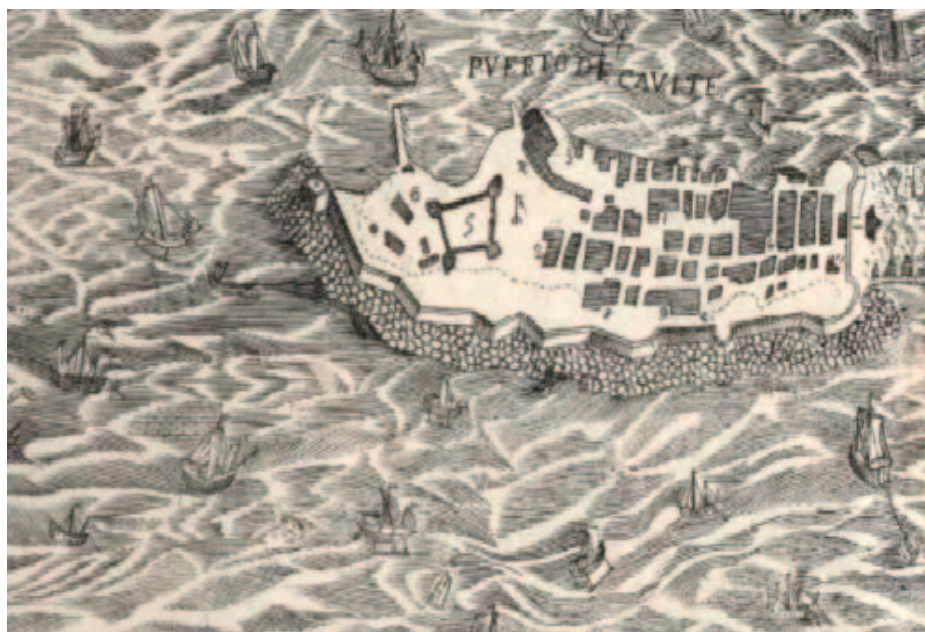
Ilustración 3. Detalle de las fortificaciones del puerto de Cavite, según figura en la carta del jesuita Pedro Murillo Velarde (1734), que incluye las defensas y el baluarte que mandó levantar el obispo Juan de Archederra. Biblioteca Digital Hispánica, signatura: MR/45/31

murallas de Manila y mandó levantar un baluarte en Cavite (1734)–, según se extrae del testimonio que, al iniciar su mandato y sobre la situación de Manila, dio el gobernador Francisco José de Ovando y Solís (1750-1754) al marqués de la Ensenada, secretario del Despacho de Marina e Indias, el 9 de octubre de 1750: