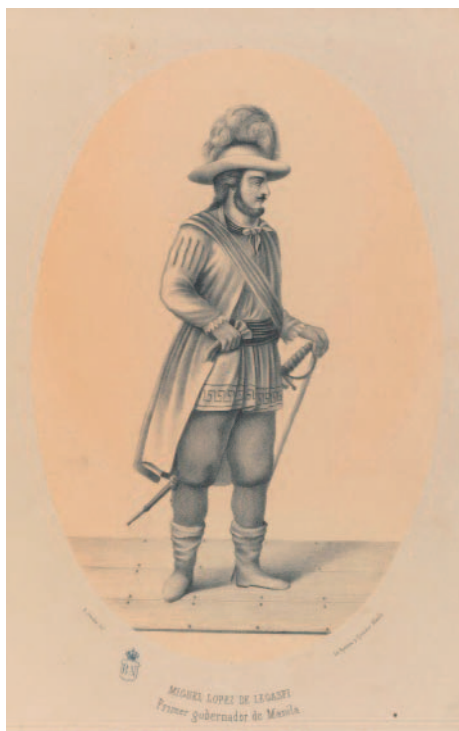
Ilustración 1. Miguel López de Legazpi. Dibujo de Baltasar Giraudier (1860). Biblioteca Nacional de España, signatura ER/2241

recibió del virrey de Nueva España, Luis de Velasco y Ruiz de Alarcón, el encargo de llevar a cabo una expedición con la que establecer el dominio de España en las tierras y aguas descubiertas por Magallanes cuatro décadas antes.