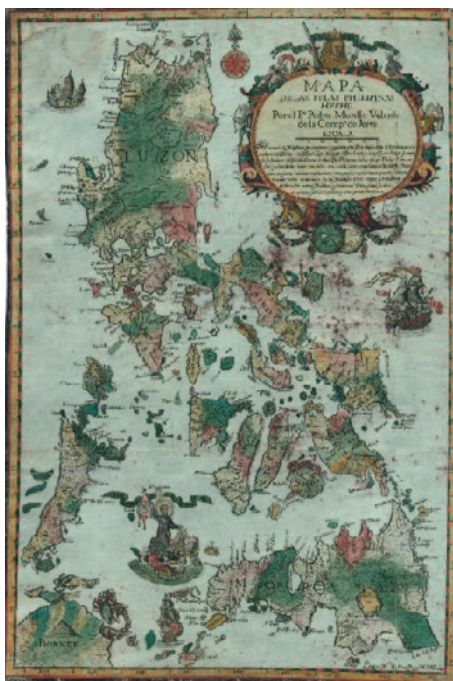
Ilustración 2. Las «Yslas Philipinas» (1734). Carta hidrográfica y corográfica del jesuita Pedro Murillo Velarde. Archivo General Militar de Madrid, signatura: PHL-120/1

Pero tanto esta medida como otras adoptadas resultarían insuficientes, a pesar del paulatino aumento de tropas a lo largo del siglo XVII y hasta mediados del XVIII, acompañado de la construcción de nuevas defensas –el obispo Juan de Archederra, siendo gobernador general, dotó de artillería de 18 a las