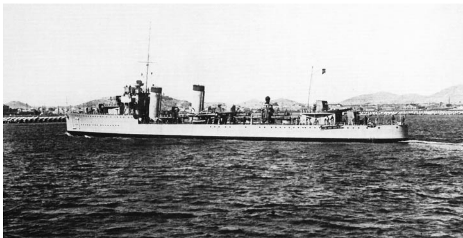
Destructor Lepanto . Colección Bazán

ejército español de ocupación 15 . Nombrado su relevo en el mando, desembarca a final de año y se le conceden dos meses de licencia, transcurrida la cual queda en situación de disponible.