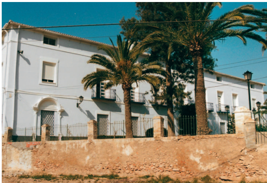
Escuela Naval Popular, Cartagena.

das» 38 . Subraya también la delicada misión que lo llevaba a esa base naval, a la que acudía para asumir, de modo permanente, el mando de todas las fuerzas de tierra, aire y mar que constituían la guarnición; mando que, por otra parte, ejercería con plenitud de poderes civiles y militares, en un territorio segregado del correspondiente a la 3. a división. Así pues, se le otorgaba independencia militar y administrativa, contando con un estado mayor mixto y «subordinado al ministro de la Guerra de quien recibirá las órdenes para la defensa» 39 de la plaza. Asimismo, por entonces se decreta «llevar a cabo la empresa de organización que ha de realizarse en todos los aspectos que abarca el completo del arma marítima» 40 , poniendo especial énfasis en la creación de la Escuela Naval Popular.