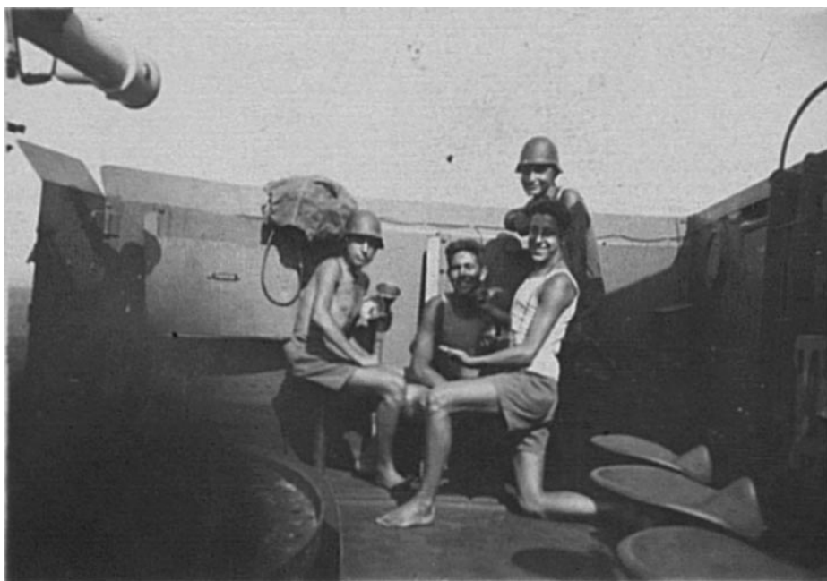
Miguel Delibes, primero por la izquierda (con casco) junto a sus compañeros en el Canarias