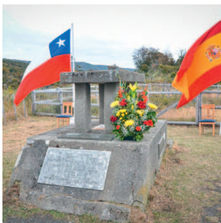
Fig. 7. Homenaje de la Armada chilena a los pobladores de Puerto del Hambre

Aunque hay historiadores que aseguran que Sarmiento fue el primero en navegar el estrecho de oeste a este, la realidad es que, dos décadas antes, un ilustre navegante, Juan Ladrillero, oriundo de Moguer y ya de edad avanzada, por orden del virrey Hurtado de Mendoza partió de la costa chilena con objeto de localizar la boca occidental de entrada. Después de alcanzar el Mar del Norte y de levantar un derrotero del canal, regresó al puerto chileno de Valdivia, como se le había ordenado. Pero los datos de su navegación no debieron de llegar a conocimiento de Sarmiento, pues de contar con ellos se habría ahorrado muchas penalidades y esfuerzos 33 .