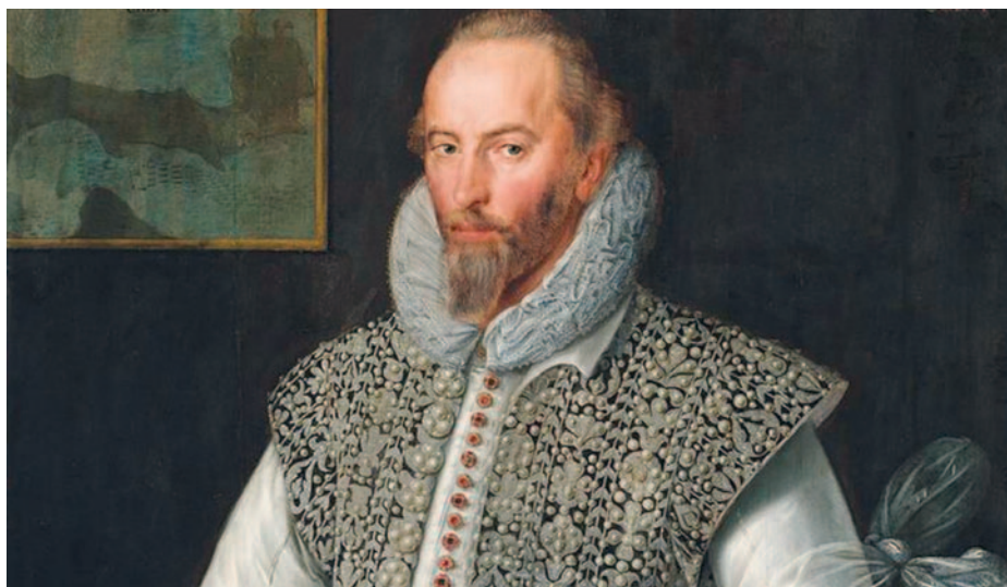
Fig. 6. Sir Walter Raleigh

ingleses 27 que, al enterarse de que por Sarmiento podían obtener un fuerte rescate, lo condujeron preso a Londres. Y cuál no sería la sorpresa del gallego al encontrarse allí con el armador de sus captores, quien no era otro que el conocido sir Walter Raleigh. Este hombre, favorito de la reina Isabel, era tan polifacético o más que Sarmiento: soldado, marino, descubridor, poeta, químico y músico. Eran dos almas gemelas, y la amistad entre ellos surgió de inmediato. Con la empatía resultante, Sarmiento cambió la prisión por un comfortable alojamiento, donde ambos, merced a su fluido latín, disfrutaron intercambiando relatos de experiencias y aventuras vividas por uno y otro hasta entonces. Raleigh le presentó al almirante de Inglaterra, lord Howard, y a la reina Isabel I, con la que Sarmiento departió hora y media. La reina le propuso actuar como su embajador ante Felipe II, para lograr un mayor acercamiento al monarca español.