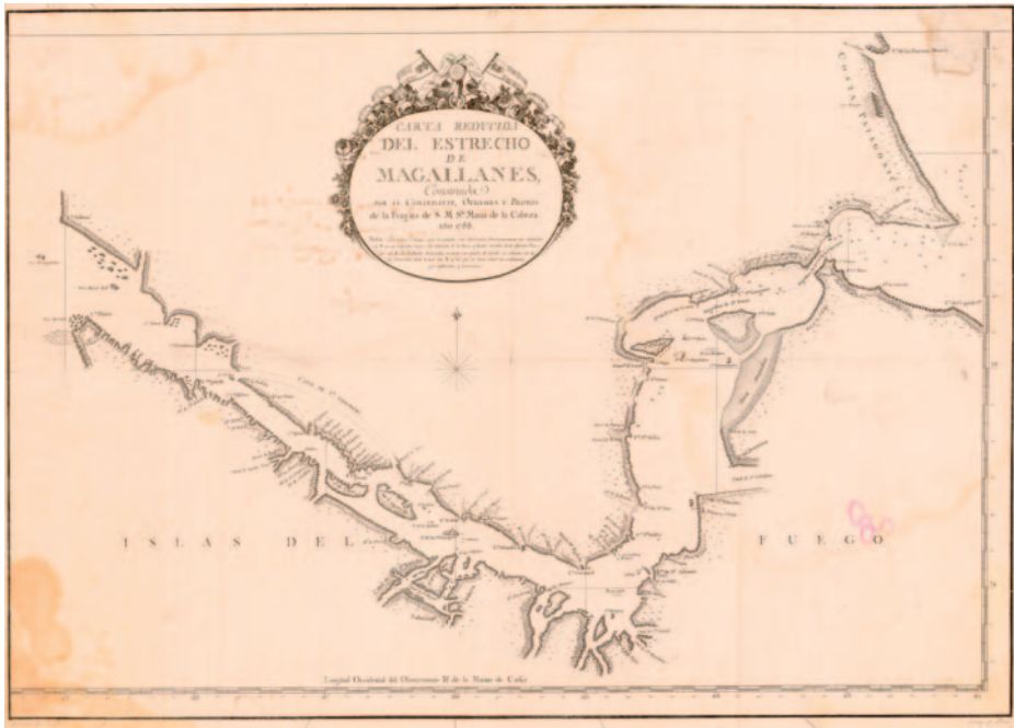
Fig. 3. Estrecho de Magallanes.

sieron el regreso a puerto. El ambiente se enturbiaba, y la prueba es que se llegó a ajusticiar a un tripulante que estaba preparando un motín. Aun así, Sarmiento se opuso al regreso, asegurando que Dios estaba con ellos. Además, los indígenas les mostraron cómo llegar al canal principal del estrecho, que se encontraba cerca, y por si fuera poco, lograron que tres lugareños embarcaran. El 9 de febrero ya eran conscientes de estar navegando en pleno canal.