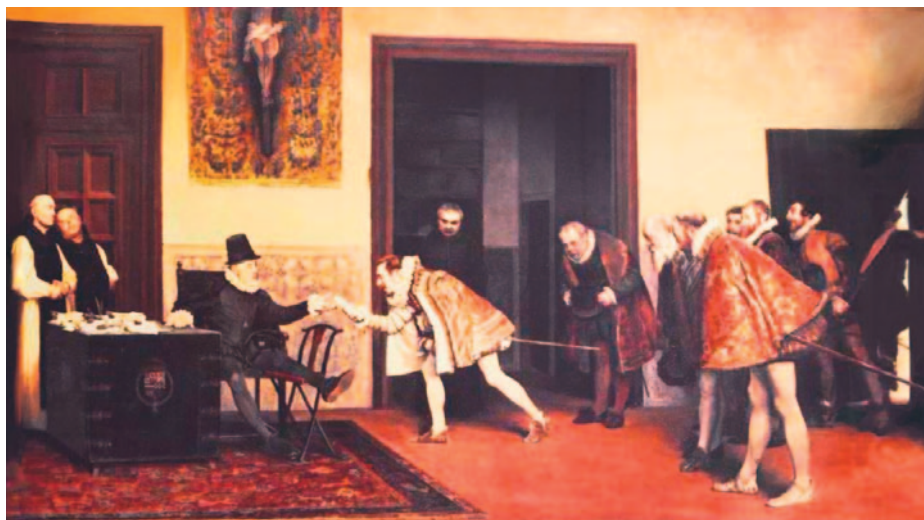
Fig. 5. Audiencia de Gamboa con Felipe II (Wikipedia)

dos mensuales; no obstante, el capitán general debería tener en cuenta su criterio. En mayo, Felipe II envió una instrucción al general sobre el cometido de su armada en la navegación al estrecho y en las fortificaciones a levantar 12 . Ya en los preparativos de Sevilla comenzarían los desencuentros de Sarmiento con el general, al seleccionar naves poco sólidas, por resultar más económicas, por lo que Sarmiento se quejó al rey, y la enemistad entre ambos líderes creció sobremedida. Según el alguacil real, al general se le veía con poco ánimo, pues esperaba hacia las tripulaciones unas palabras de aliento que nunca se dieron, ante un proyecto que parecía extraordinariamente complicado. Como almirante navegaría don Diego de Rivera, y como ingeniero experto en fortificaciones, el italiano Antonelli 13 .