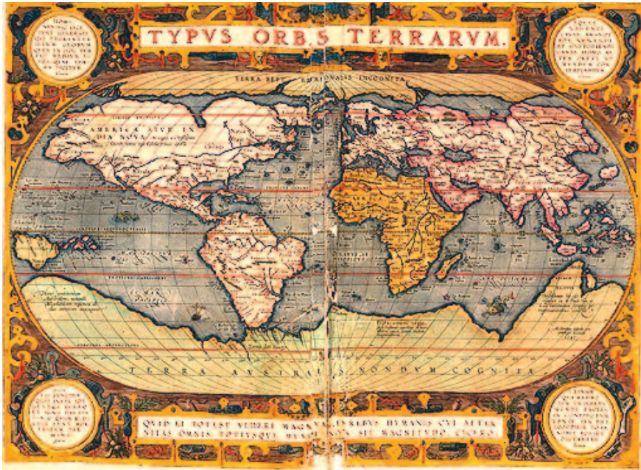
Fig. 2. Mapamundi de Ortelius. Web Biblioteca Complutense

archipiélago de las Salomón. La denuncia del piloto mayor por Sarmiento fue obviada por Mendaña y, a partir de aquí, se sucedieron varios desencuentros con el general, hasta el punto de que, al regresar a puerto en Nueva España, lo denunció al virrey. Ante esta situación, Mendaña apresó a Sarmiento, pero este pudo escapar y en un careo ante el virrey, Francisco de Toledo, el gallego fue reconocido como el descubridor de las islas Salomón (ALONSO ROJO: 2016, pp. 30, 31) 4 .