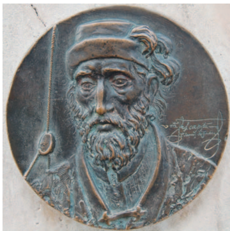
Fig. 1. Sarmiento de Gamboa

fo y piloto, calculando con procedimientos pioneros la longitud y la latitud en el hemisferio austral, tras reconocer las estrellas próximas al polo sur geográfico.