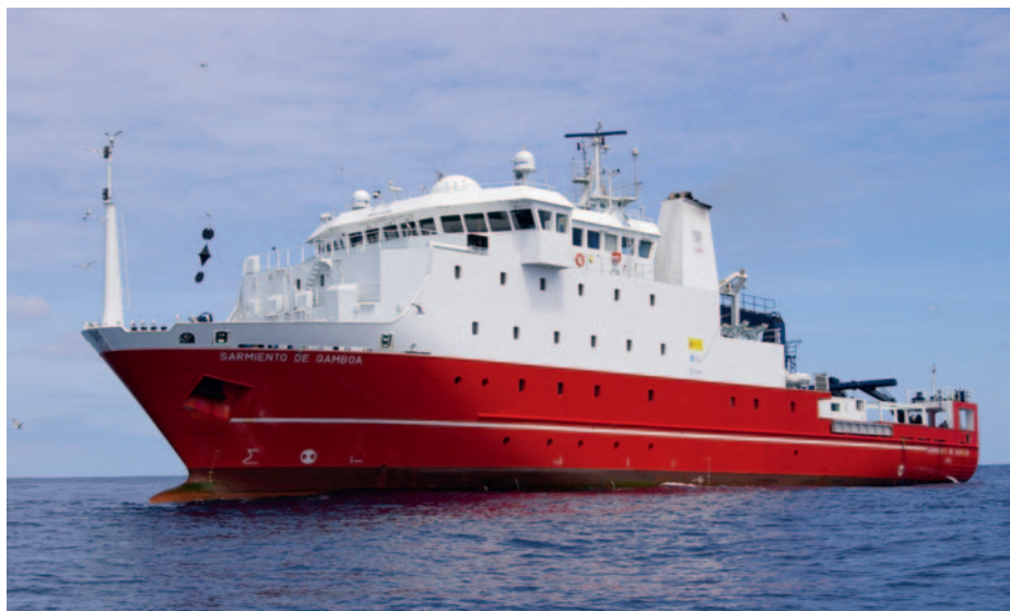
Fig. 8. Buque de exploración oceanográfica Sarmiento de Gamboa (CSIC)

la precariedad de recursos. Su derrotero, que permaneció perdido hasta el reinado de Carlos III, fue utilizado por navegantes tan conocidos como los ingleses Fitz Roy y Byron, el brigadier Alejandro Malaspina y muchos otros. Afortunadamente, su meritorio historial es reconocido por sus compatriotas, y actualmente, un moderno buque de exploración oceanográfica, operado por el CSIC, lleva su nombre, así como antiguos buques de guerra de la Armada lo han portado también sobre su costado. Una montaña con hielo permanente al sur del estrecho ha sido bautizada como Sarmiento, y el mayor lago de Chile, ubicado en la región de Magallanes y de la Antártica Chilena, es conocido como Sarmiento de Gamboa.