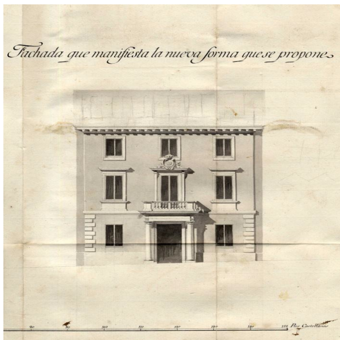
Proyecto de modificación

La escritura había sido otorgada al Rey el 13 de septiembre de 1800 por un valor de 300.000 reales de vellón, en vales. La Corona la cedió a la Dirección de Hidrografía y mandó que se costeara su reedificación, concluida a finales de 1803 ascendiendo a 696.262 reales de vellón.