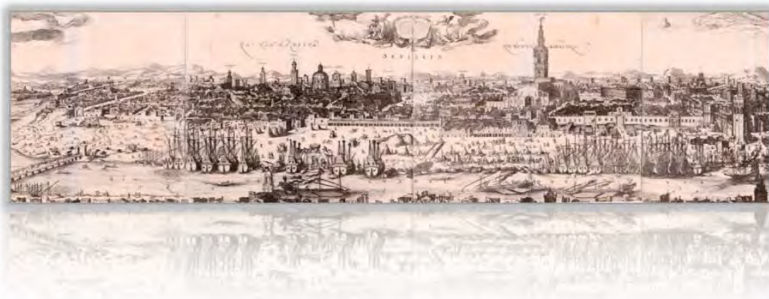
Vista panorámica de Sevilla. Grabado por Ianssonius, 1617 (Museo Naval de Madrid)

La Casa de la Contratación será la institución en la que se centralizarán todos los asuntos relacionados con el comercio y tráfico de Indias.