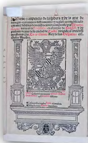
Breve Compendio de la sphaera y de la arte de navegar de Martín Cortés (Cádiz, 1551)