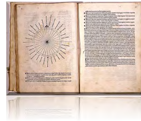
Suma de Geographia de Fernández de Enciso (Sevilla, 1519)

El primer Tratado español sobre navegación, autorizado por la Casa , fue Suma de Geographia de Martín Fernández de Enciso, publicado en Sevilla en 1519.