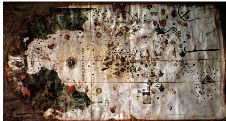
Carta de Juan de la Cosa (1500). Museo Naval de Madrid Es una Carta Universal prototipo de las que más tarde conformarán el Padrón Real

La Carta de Juan de la Cosa marca el comienzo de la Escuela Sevillana de La Casa de la Contratación centrada en los Descubrimientos y el Nuevo Mundo, y la decadencia de la Escuela Mallorquina de tradición medieval volcada en el Mediterráneo y cuyo mayor exponente eran Los Portulanos