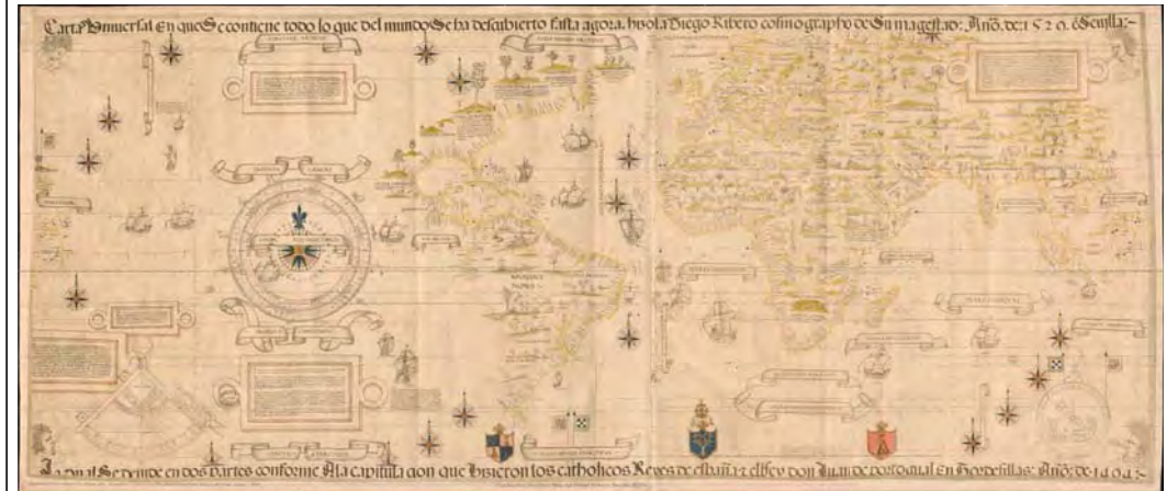
Mapamundi de Diego Ribero (1529)

De esta forma, durante la mayor parte del S.XVI hubo en La Casa dos cosmógrafos simultáneamente