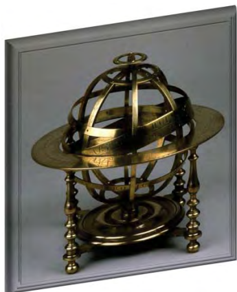
Esfera armilar (Museo Naval de Madrid)