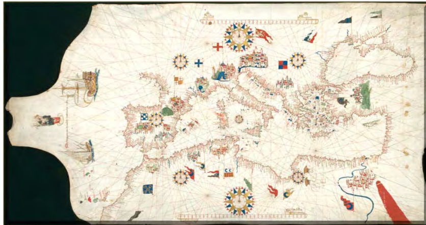
Portulano de Mateo Prunes. (Museo Naval de Madrid)

Los Portulanos, por su estructura de carta plana fueron perfectos para la representación del Mediterráneo, pero arrojaban errores importantes al representar otras latitudes geográficas.