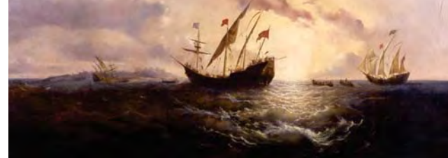
Alba de América (12 octubre 1492). Oleo de Antonio Brugada realizado en 1856 Vista de las tres naves de Colón llegando a las costas de Indias Occidentales (Museo Naval de Madrid)

Se pasará de una Navegación de Cabotaje y Costera , con el sistema de rumbo y distancias sin perder de vista las costas y sus accidentes, a otra de Altura y Océánica , sin referencias geográficas precisas ni antecedentes de otras navegaciones.