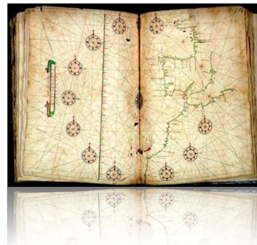
Carta de navegación de Escalante de Mendoza. En su Ytinerario de navegación (Sevilla, 1575) (Archivo del Museo Naval)

También es de destacar Juan Escalante de Mendoza con su Ytinerario de navegación (1575) que constituye un verdadero Regimiento de Navegación eminentemente práctico y escrito en forma de diálogo entre un experimentado piloto y un joven interesado en asuntos marítimos.