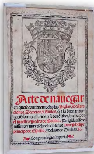
Arte de Navegar de Pedro de Medina (Valladolid, 1545)

Pero será con las obras de Pedro de Medina y Martín Cortés con las que se iniciará una época distinta en la literatura náutica, superando el nivel de "recetario" práctico o manual escolar propio de los textos anteriores.