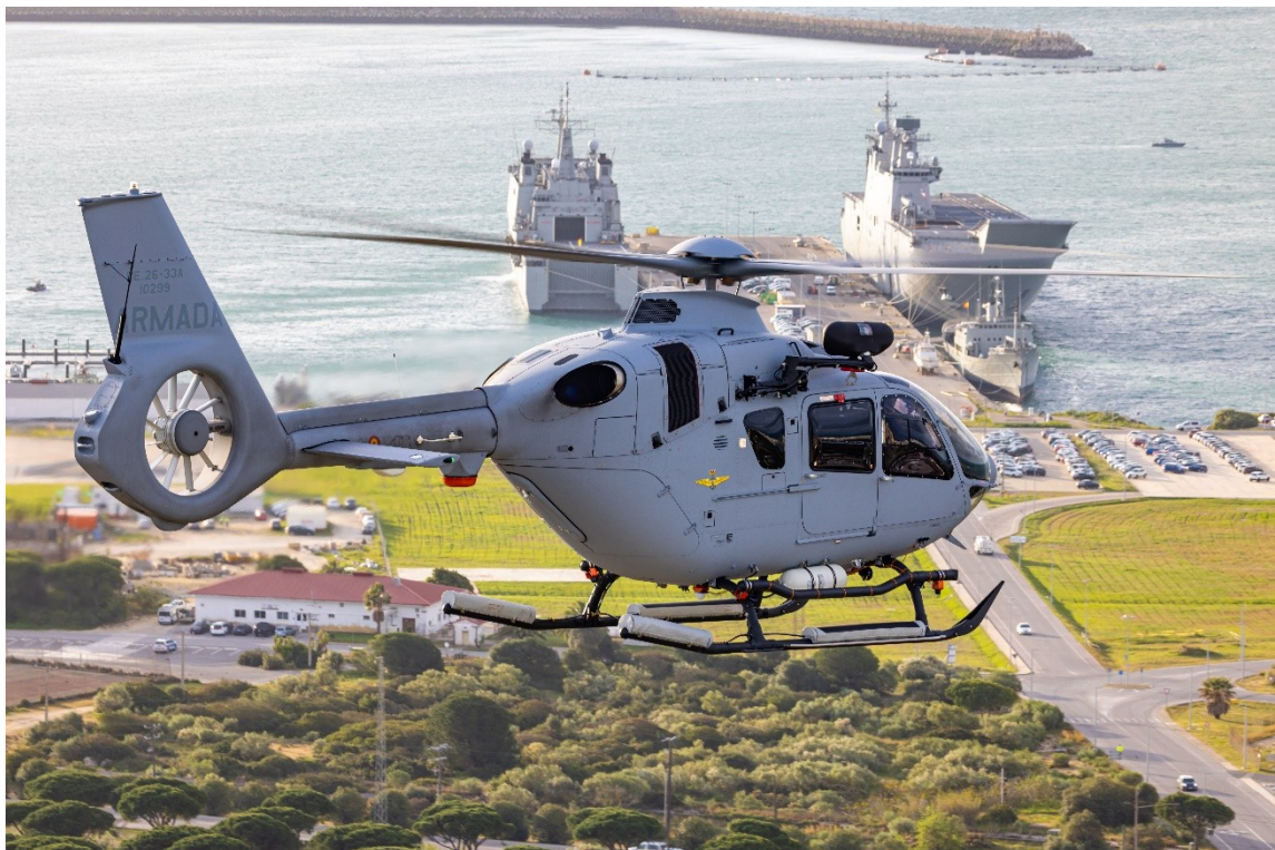
Aires nuevos a estribor