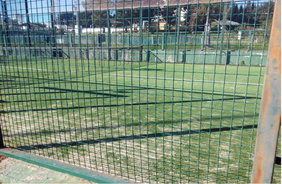
Reposición de las redes de la cancha de fútbol.