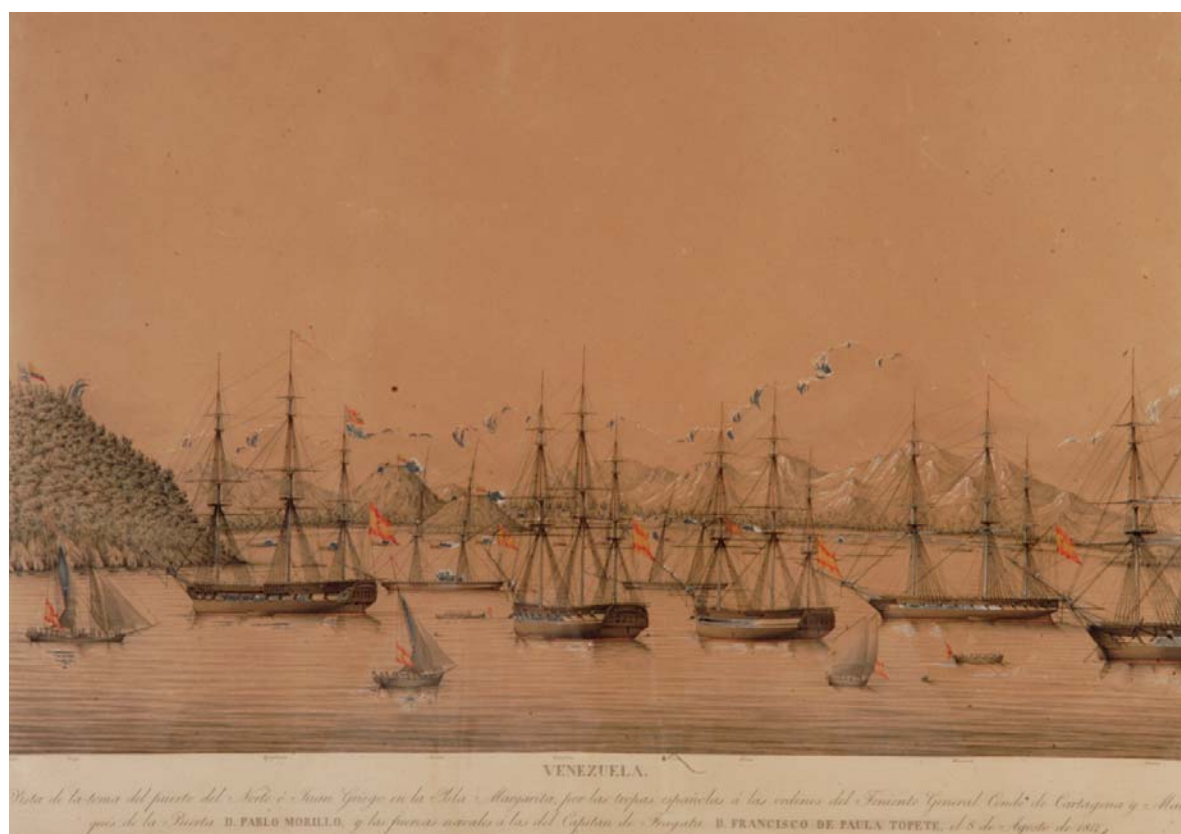
Campaña de Venezuela. Toma del Puerto del Norte o Juan Griego, en la isla Margarita, por las fuerzas navales y terrestres españolas a las órdenes del teniente general Pablo Morillo (8 de agosto de 1817). (Museo Naval. Madrid).

Desde esta fecha hasta el 17 de febrero de 1815 estuvo la tropa destinada a la expedición acuartelada y vigilada para evitar desertiones, anunciándose todos los días su salida para el día siguiente ante el disgusto de las propias tropas y su general en jefe. La expedición se haría a la mar, finalmente, dicho día 17 de febrero. Se hallaba compuesta de 10.000 hombres efectivos. En