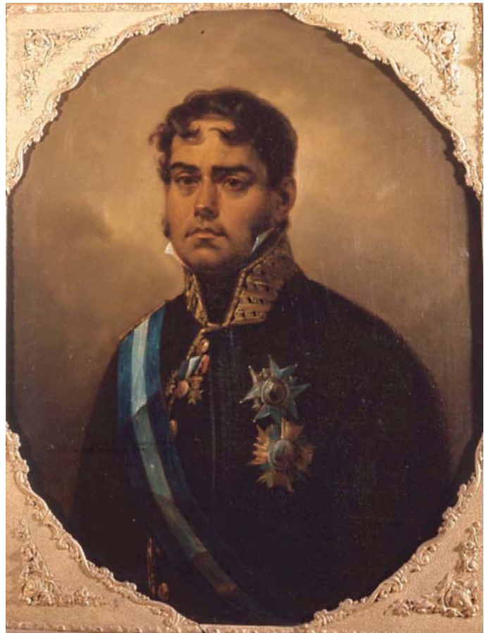
Retrato de Pablo Morillo (1179-1837), conde de Cartagena y marqués de la Puerta, teniente general del Real Ejército, sargento del Real Cuerpo de Infantería de Marina. (Museo Naval. Madrid).

El adiestramiento del Ejército de la Junta Suprema de Sevilla en los campos de Utrera en junio de 1808 selló para siempre el destino de Pablo Morillo, al abandonar definitivamente la Marina (15). Aunque su experiencia