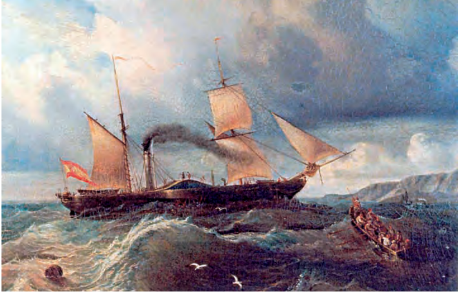
El vapor Isabel II . (Óleo de Antonio de Brugada. Museo Naval. Madrid).

La construcción de su casco había sido dirigida por Cabrera, carpintero de ribera y calafate, en un pequeño astillero situado en Remedios de Triana, mientras que la máquina y la caldera (ovoidal) fueron traídas de Inglaterra. Botado en la tarde del día 30 de mayo de 1817, tenía 21,37 metros de eslora, 6,76 de manga (incluyendo las ruedas), 3,27 de puntal y 8,8 de calado (1). Estaba dotado de dos ruedas, cada una de ellas dividida en cinco palas. Su velocidad mínima no bajaba de los cuatro nudos (2). Las cámaras de proa y popa tenían capacidad para albergar un total de 65 pasajeros, mientras que en cubierta podían ir de 40 a 50. Disponía de dos camarotes con capacidad para cuatro personas cada uno. Los precios establecidos para estas últimas dependencias ascendían a 120 reales de vellón, mientras que por cada asiento en la cámara de popa se pagaban 60 y en la de proa 40, resultando el billete más