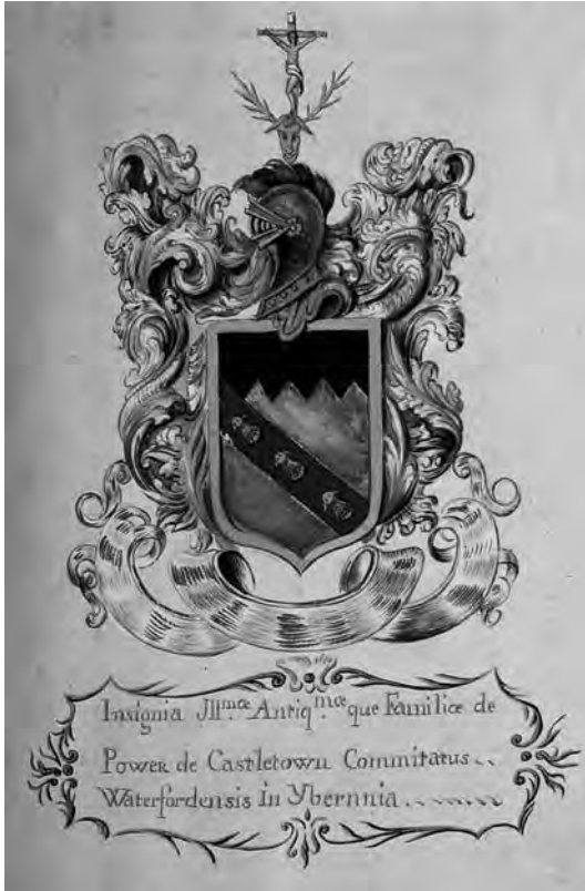
Escudo nobiliario de la familia Power de Castletown.