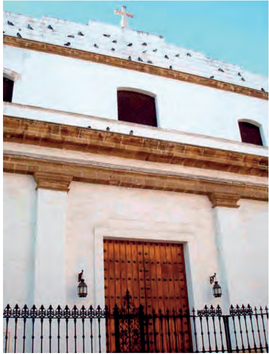
Fachada de la Parroquia Castrense de Cádiz.