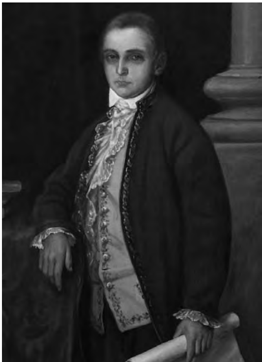
Retrato del diputado por Puerto Rico Ramón Power. (Obra del pintor Federico Godoy, efectuada en 1920. Museo de las Cortes. Cádiz, calle Santa Inés, n.º 9).

atos de Nueva España, Perú, Santa Fe y Buenos Aires, así como las capitanías generales de Cuba, Puerto Rico, Santo Domingo, Guatemala, Provincias Internas, Venezuela, Chile y Filipinas. Atendiéndose a lo mandado en el mismo, se celebró el siguiente 17 de abril un cabildo extraordinario en la ciudad de San Juan, para efectuar la elección y el sorteo de quién debería ostentar la representación de Puerto Rico ante las Cortes que habría de celebrar la nación. El acto tuvo lugar en el Ayuntamiento de la capital. En primer lugar, se efectuó la elección para nominar a tres individuos naturales de la provincia, dotados de probidad, talento e instrucción y exentos de toda nota desfavorable. En la votación, el obispo de la Diócesis, Juan Alexo de Arismendi, obtuvo cinco votos; el oidor honorario, fiscal de Justicia y de la