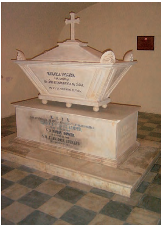
Urna funeraria con los restos de Ramón Power, y de otros diputados, en el Oratorio de San Felipe Neri de Cádiz.

proveniente directamente de las Parroquias, y fue depositado en la puerta Norte, fila 4. a , nicho n.º 21 (58). En consecuencia, los restos fueron inhumados poco después de su muerte, la misma tarde en la que aconteció. La precipitación por sacar el cadáver de la ciudad y trasladarlo al camposanto extramuros, sin ni siquiera velarlo, puede ponerse en relación directa con el gran temor que causaba el contagio de la fiebre amarilla, de la que se desconocía el agente causal.