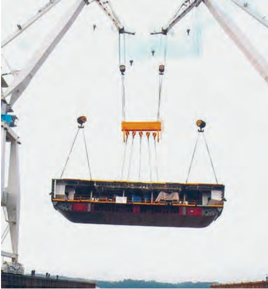
Puesta de grada del primer bloque del LHD Juan Carlos I .

Esta técnica de construcción, empleada en los mejores astilleros, permite que gran parte de la soldadura, montaje de polines y tuberías e incluso pintado se realice cuando los bloques se encuentran en talleres por lo que es posible mejorar el rendimiento del proceso de construcción y efectuar un trabajo de más calidad en un menor tiempo.