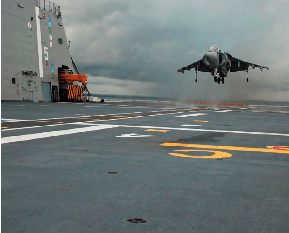
Primera toma en cubierta de un AV 8B.

tramamiento de la dotación, aunque las limitaciones presupuestarias solo han permitido la adquisición parcial de los repuestos y pertrechos necesarios para llevar a cabo estas actividades. Una de las principales actividades que se llevan a cabo son las encaminadas a certificar la cubierta de vuelo para realizar operaciones con las distintas aeronaves que está previsto operen desde este buque.