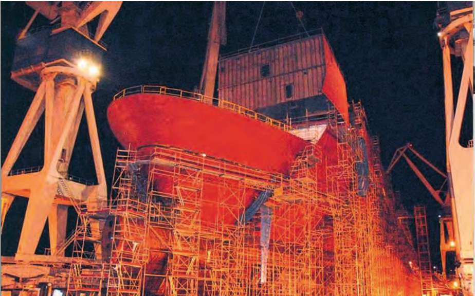
Estado de avance de la construcción en diciembre de 2007.

La construcción del buque continuó en grada hasta que en marzo de 2008 el buque conta-