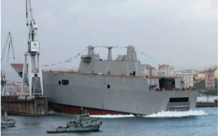
Botadura del buque en marzo de 2008.

ba con un suficiente nivel de acabado para proceder a la botadura del mismo. Los trabajos de construcción continuaron con el buque atracado en Ferrol donde comenzó la instalación de diversos equipos y sensores. Una idea de la