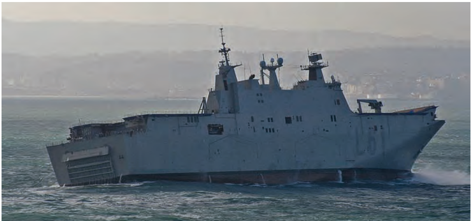
El LHD Juan Carlos I navegando con mala mar.

ba con un suficiente nivel de acabado para proceder a la botadura del mismo. Los trabajos de construcción continuaron con el buque atracado en Ferrol donde comenzó la instalación de diversos equipos y sensores. Una idea de la