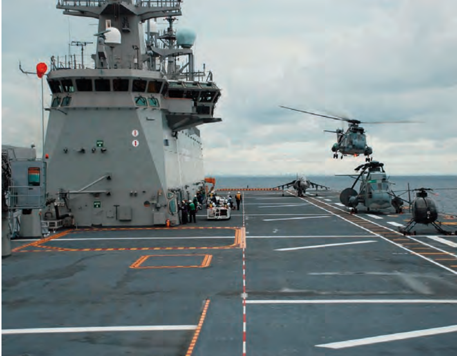
Primera toma en cubierta de la UNAEMB.