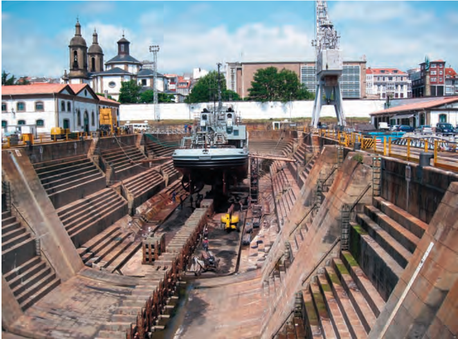
El Mahón en el dique de la Campana.

impracticables por su alto costo, la pérdida de personal cualificado, o cambios en la normativa industrial nacional, entre otras razones.