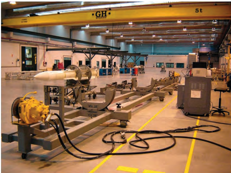
Interior del taller de misiles.

Es conocido que en nuestros arsenales se tiende, desde hace ya tiempo, al abandono paulatino de la actividad industrial propia, que es sustituida por las labores técnicas y administrativas necesarias para gestionar su realización por empresas del sector correspondiente. De esta forma, se va profundizando en la gestión, conforme se van abandonando capacidades que resultan ineficientes o