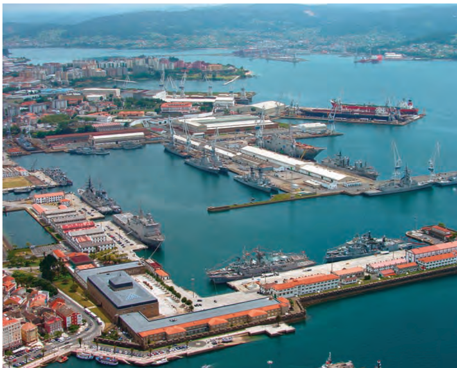
Vista aérea del Arsenal de Ferrol.

La primera infraestructura logística se estableció en La Graña en 1724. Reinaba Felipe V y Patiño era el secretario de Marina. Pero pronto se vio que el lugar no ofrecía las posibilidades de crecimiento que requeriría el objetivo de fuerza pretendido en el planeamiento estratégico. Y así: «un escrito de la