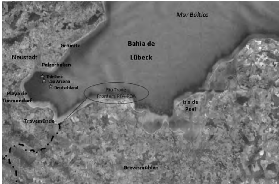
La bahía de Lübeck y los lugares de fondeo de los tres buques. (Composición del autor).

A escasos 20 km al sureste de Hamburgo existía un gran campo de concentración, Neuengamme, del que además dependían cerca de un centenar de otros campos de diverso tamaño (en Mecklenburg, Westfalia, Holanda o incluso en la británica isla de Alderney, en el Canal). Toda esa vasta y particular organización estaba bajo el mando del comandante del campo de Neuengamme, el sturmbannführer Max Pauly. A 29 de marzo de 1945, el total de reclusos en toda la red de campos era de 40.393 hombres y 12.103 mujeres, de los cuales 12.536 hombres se encontraban en Neuengamme, la mayoría prisioneros de guerra rusos y polacos, pero no exclusivamente, también había franceses, belgas, daneses e incluso alemanes.