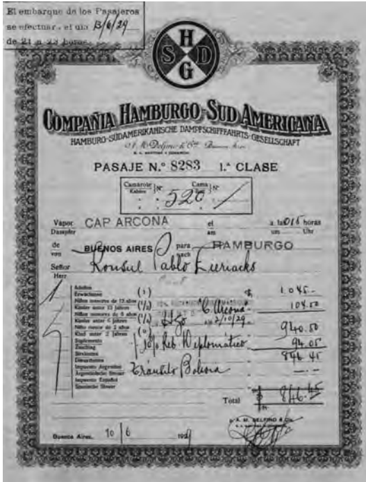
Pasaje de primera clase para el Cap Arcona , con su descuento del 10 por 100 para diplomáticos.

oportunidad de retractarse de sus «manifestaciones derrotistas» a cambio de su libertad, Selpin sorprendentemente se negó. Los años de acomodación a un régimen totalitario, de autocensura y autonegación habían ido erosionándolo. Un simple asunto amoroso y la traición de un amigo fueron el detonante. Selpin apareció muerto en su celda el 1 de agosto, ahorcado con sus tirantes. No se ha determinado si fue suicidio o asesinato, aunque las especulaciones sobre un posible acto de depuración nazi no son muy consistentes.