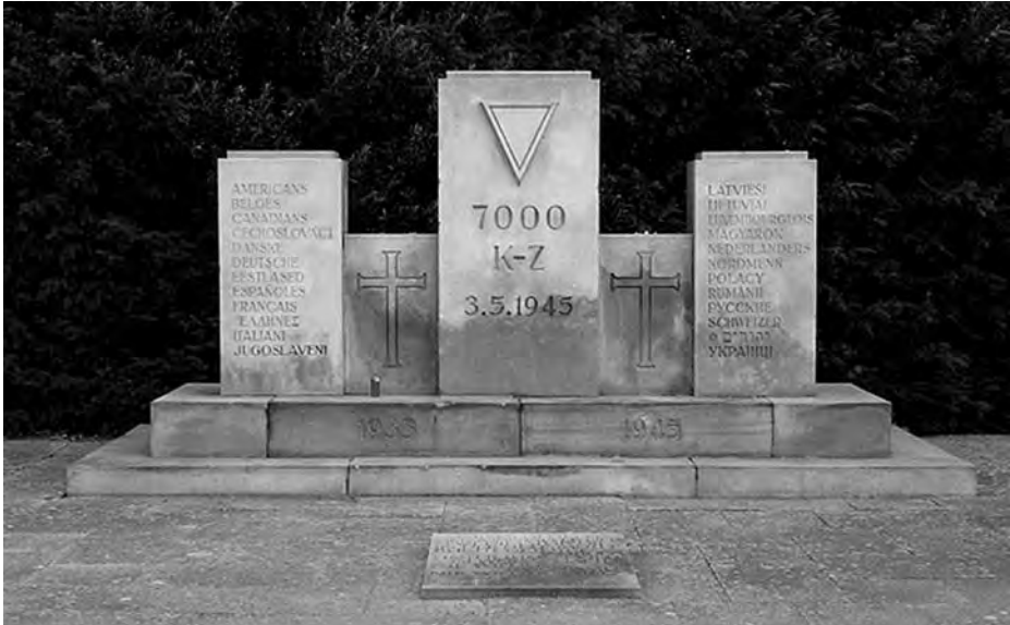
Cenotafio de Neustad Holstein que conmemora a las víctimas.

mismo, se lo dijo durante la fiesta de celebración del armisticio, la noche del 5, un compañero que había estado en Lübeck. Obviamente no podía ser ningún secreto, menos aún para las fuerzas de ocupación terrestres, que tuvieron que gestionar la repatriación de los supervivientes y no pudieron además dejar de tener conocimiento de los 2.929 restos mortales que hasta 1950 el mar fue arrastrando hasta las playas de su zona.