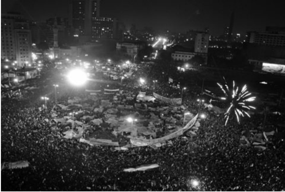
Celebraciones en la plaza de Tahrir en El Cairo después de la caída de Mubarak.

mica mundial, como se deduce de la mera observación de los informes del Programa de las Naciones Unidas para el Desarrollo (PNUD); la caída en estos capítulos puede imputarse como el detonante de las primaveras árabes , como en los años ochenta lo fueron las revueltas de la sémola , proceso paralelo al actual —aunque no de igual intensidad—, suscitado en aquella ocasión por el encarecimiento de los productos de primera necesidad y la caída de ingresos procedentes de los hidrocarburos.