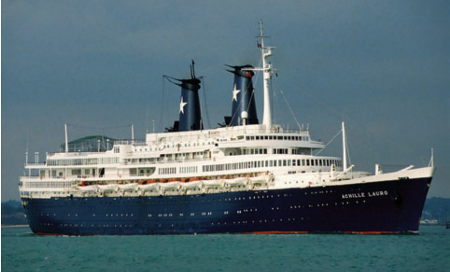
El Achille Lauro , secuestrado por terroristas del FLP, en octubre de 1985. (Autor: Allan Ryszka-Onions).

puestos a disposición de la OLP. Cuando el avión 737 de Egypt Air en el que volaban, acompañados por Abu Abbas, se dirigía hacia Túnez, fue interceptado por aviones F-14 del portaaviones USS Saratoga y obligado a tomar en la base aeronaval de Sigonella, en Sicilia. Los terroristas responsables del secuestro fueron juzgados en Italia. Abu Abbas fue puesto en libertad por falta de pruebas, aunque posteriormente sería juzgado por rebeldía por un tribunal italiano, que le condenó a cadena perpetua (6).