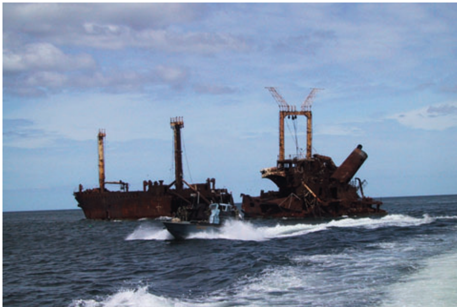
Una embarcación armada de los Tigres del Mar navegando próxima a un mercante de dicho grupo destruido por la aviación de Sri Lanka. (Autor: Isak Berntsen).

Entre las acciones del grupo se cuentan ataques contra los buques y el personal de las compañías petrolíferas extranjeras radicadas en la zona, como