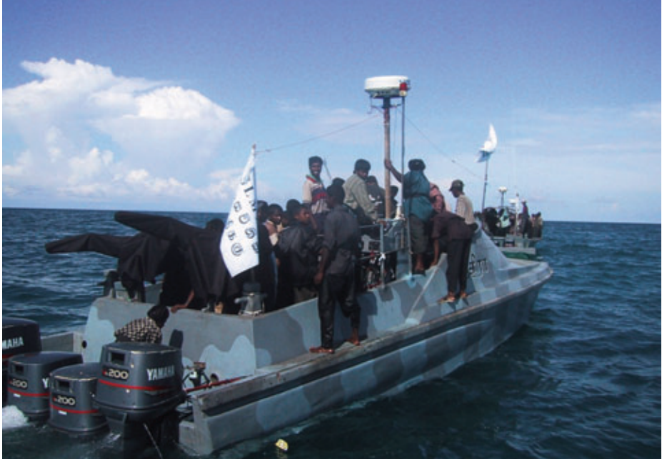
Embarcaciones de los Tigres del Mar efectuando transporte de personal.

contrabando de armas cuando un patrullero se acercaba a investigarlo (5). Además, disponían de buceadores adiestrados en la colocación de minas bajo el agua, que operaban con embarcaciones semisumergibles, y que en 2008, ya casi al final del conflicto, hundieron un patrullero y un buque logístico.