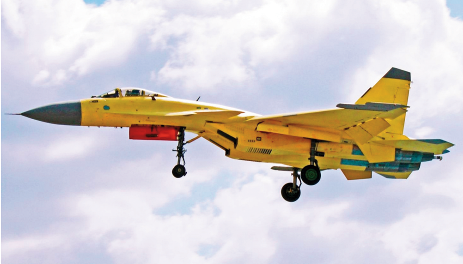
Cazabombardero J-15 . Apreciarse gancho de frenado en popa.