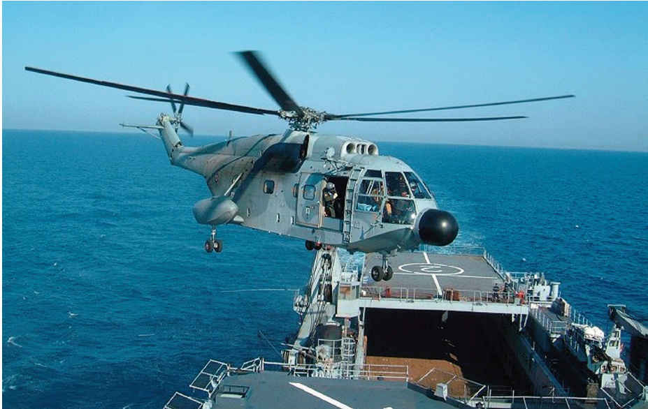
Helicóptero Super Frelon .

allá de su zona de influencia. Por esto no sorprenden las negociaciones con el gobierno de Pakistán para la obtención de una base en Gwadar, en el océano Índico, para proyectar su poder naval sobre el Oriente Medio y el este de África. Como era de esperar, el sensible nacionalismo indio, que no olvida la lección recibida en los Himalayas, lo considera una provocación en su particular Mare Nostrum asiático.