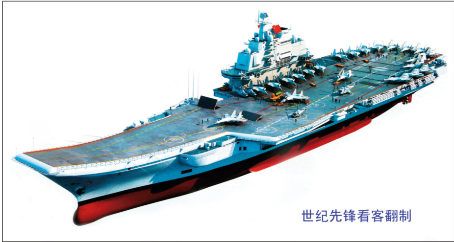
Impresión artística del Shi Lang .

Marina de carácter costero, a la par que se avanzaba gradualmente, primero con tecnología soviética, y actualmente propia, a la que a algunos les gusta definir como una I + D inversa o, peyorativamente, copiada.