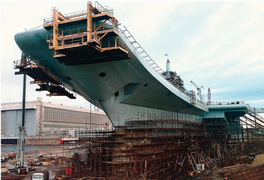
En el astillero de Sevmesh.