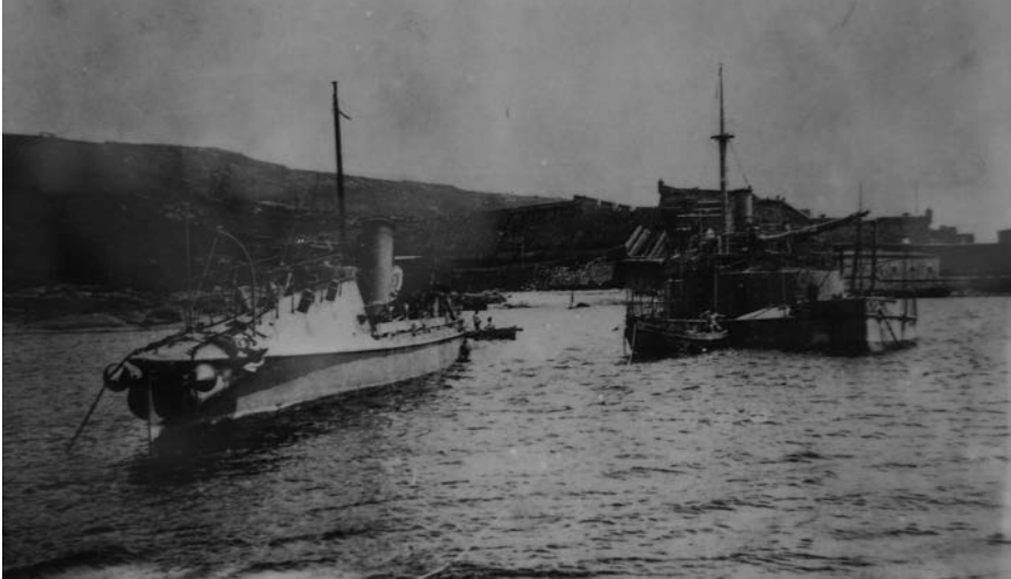
La Duque de Tetuán en Ferrol defendiendo la ría en 1898.

razón por la que no entraría en servicio hasta 1876, bajo el mando del teniente de navío de primera clase José de la Puente y Sedano.