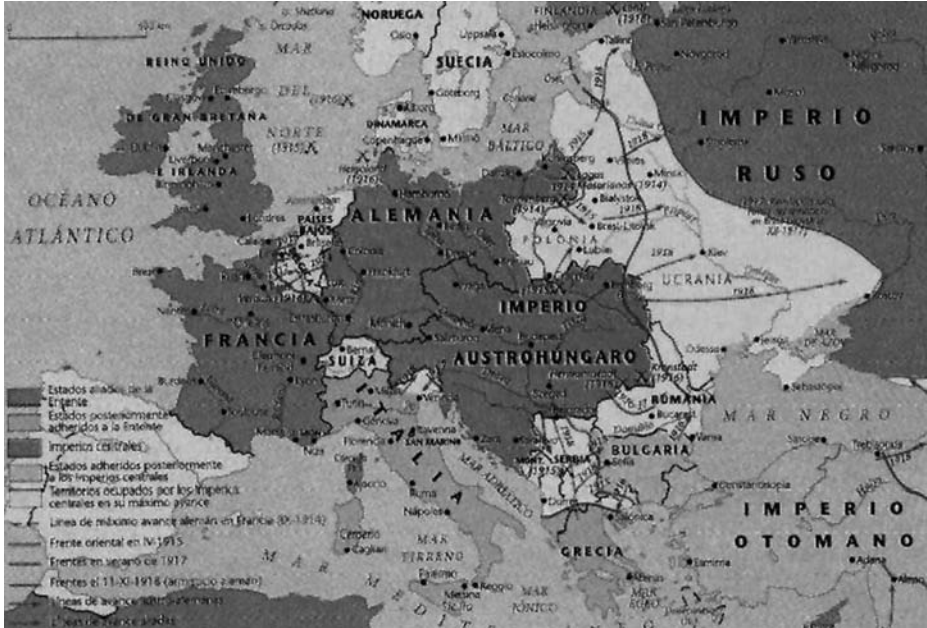
Europa en los inicios de la Primera Guerra Mundial y frentes abiertos.

Estonia, Lituania, Letonia y Yugoslavia. Austria y Hungría se separaron definitivamente en dos Estados. Por lo que se refiere al papel que asumió la flota internacional reunida en el estrecho del Bósforo en su misión de neutralizar el mar Negro e impedir que el conflicto de los Balcanes se extendiera, resulta notorio que propició el acuerdo de numerosos Estados nacionales europeos — entre ellos grandes potencias imperiales—, que de facto tenían intereses muy diversos, pero que también fueron capaces en aquel momento tan difícil de aunar fuerzas con un mismo objetivo: preservar la paz. Lamentablemente y como nos enseña la Historia, aquellas naciones pronto serían beligerantes entre sí, anteponiéndose una vez más e irremisiblemente los hechos a los esfuerzos políticos y diplomáticos.