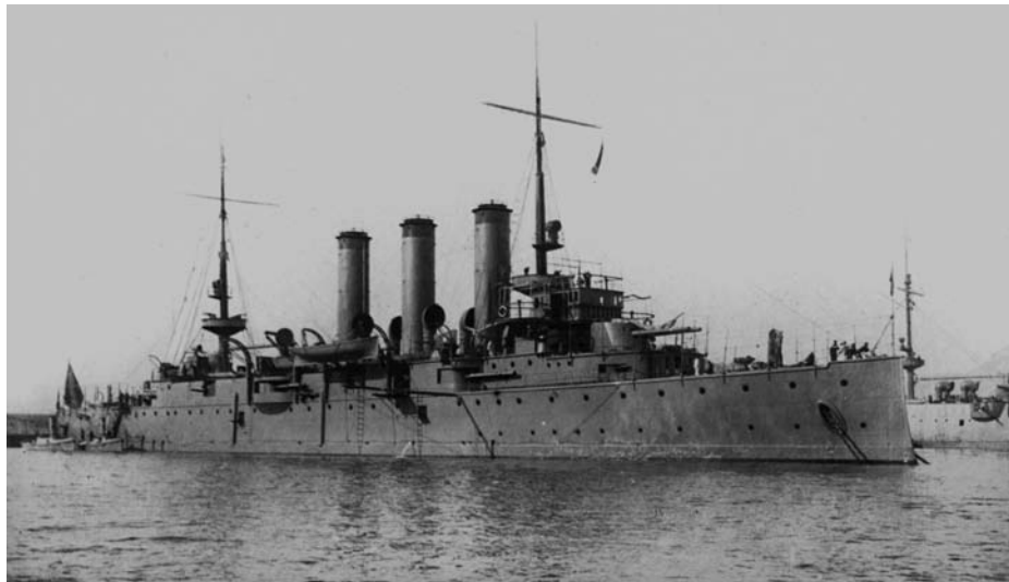
Crucero protegido Reina Regente , enviado por España al Bósforo en noviembre de 1912.

y Méndez (3), primero, y después por Álvaro Figueroa y Torres, conde de Romanones (4), decidió el envío al Próximo Oriente —y posterior permanencia— del crucero Reina Regente , que en aquella época era el mejor barco de guerra operativo y el más moderno de la Armada.