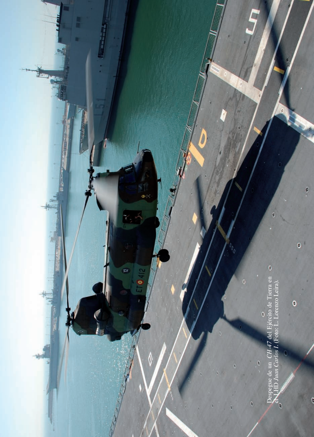
Despegue de un CH-47 del Ejército de Tierra en el LHD Juan Carlos I.