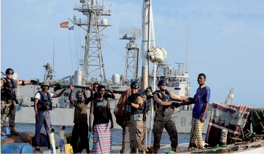
Liberación de un dhow por la fragata Reina Sofía .

empleo conjunto de los recursos es más efectivo que en el pasado. Asimismo, durante los últimos meses se han desplegado en la zona nuevos tipos de unidades y plataformas mejor equipadas: desde medios para realizar ISR (8) hasta submarinos o equipos de operaciones especiales, particularmente eficaces en la neutralización de los buques madre de los grupos de acción de piratas. Se han utilizado además, por primera vez, equipos de protección autónomos para proteger a los buques del WFP (9). Estos equipos, de unas 20 personas, pueden defender a un buque mercante vulnerable sin necesidad de que haya un buque escolta en las proximidades, lo que permite liberar unidades para otras misiones.