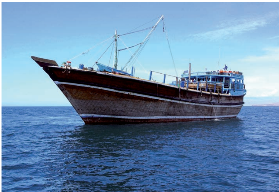
Dhow tipo Jelbut en el golfo de Adén.

Durante los pasados tres años, debido fundamentalmente a la presión de las fuerzas navales, el área de operaciones de los piratas se ha expandido desde una zona relativamente concentrada en el golfo de Adén y proximidades de la costa de Somalia hacia el océano Índico hasta posiciones alejadas cerca de dos mil millas de la costa de Somalia. Se han valido para ello del secuestro de dhow s (1) que, utilizados como buques madre, permiten a los piratas trans-