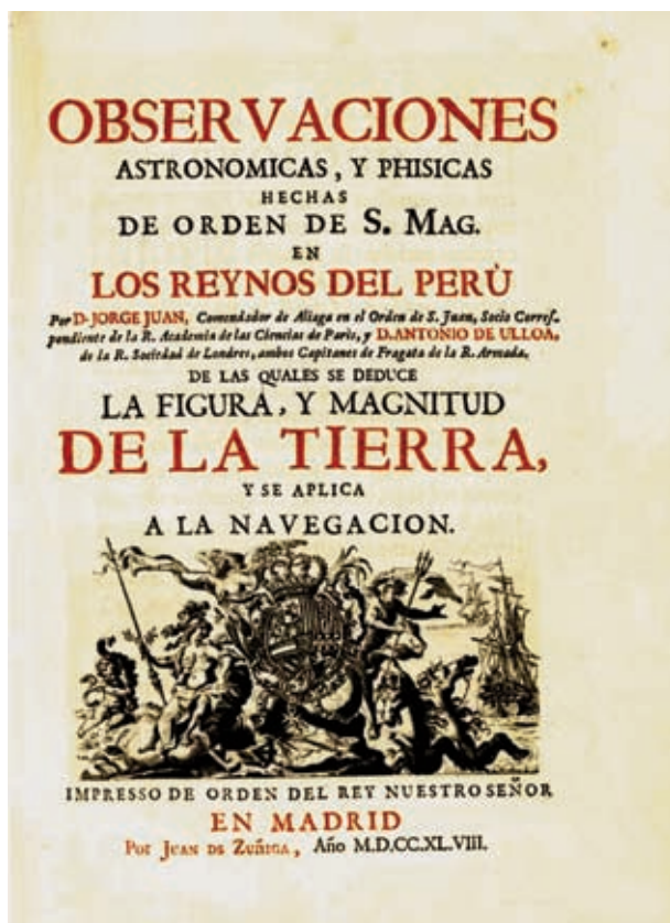
Portada del libro Observaciones astronómicas y físicas hechas en el Reino del Perú . (Museo Naval de Madrid).

biografías y monografías dedicadas a su persona y a sus trabajos. El propio Jorge Juan ha dejado varios trabajos escritos de gran interés, entre ellos: Compendio de navegación (Cádiz, 1757), Examen marítimo teórico-práctico (Madrid, 1771) o Estado de la astronomía en Europa (Madrid, 1773). Además de otros trabajos desarrollados con Ulloa, como: Observaciones astronómicas y físicas hechas en los Reynos del Perú (Madrid, 1748), Relación histórica del viaje hecho de orden de su Majestad a la América Meridional (Madrid, 1748), Disertación Histórica y Geográfica sobre el Meridiano de Demarcación entre los dominios de España y Portugal (Madrid, 1749) o Noticias Secretas de América, sobre el estado naval, militar y político del Perú y provincia de Quito . Esta última obra, que no se llegó a publicar en España por su confidencialidad, fue publicada por David Barry en Londres en 1826 sin ajustarse en