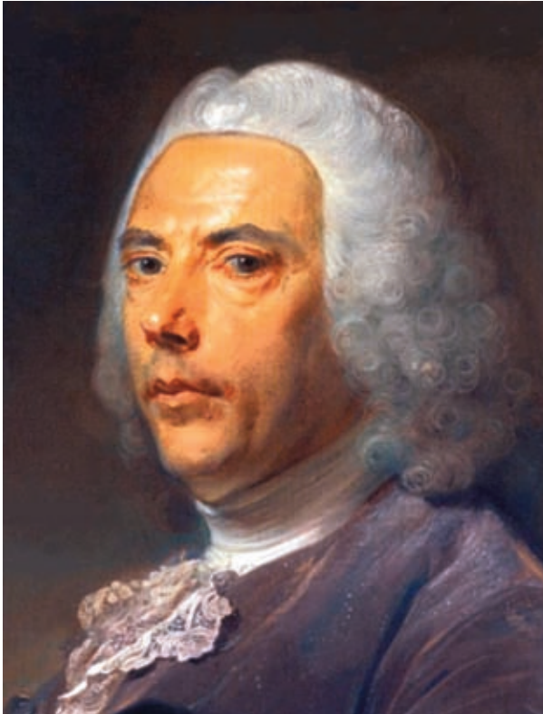
Retrato de Bouguer.

hombres: nueve científicos —entre ellos Louis Godin, matemático y presidente de la comisión que él mismo había propuesto; Pierre Bouguer, astrónomo, geógrafo e hidrógrafo, y Charles-Marie de La Condamine, matemático y geógrafo—, seis esclavos negros y siete criados. Y por parte de España fueron elegidos los dos jóvenes oficiales de la Armada antes citados: Jorge Juan y Antonio de Ulloa.