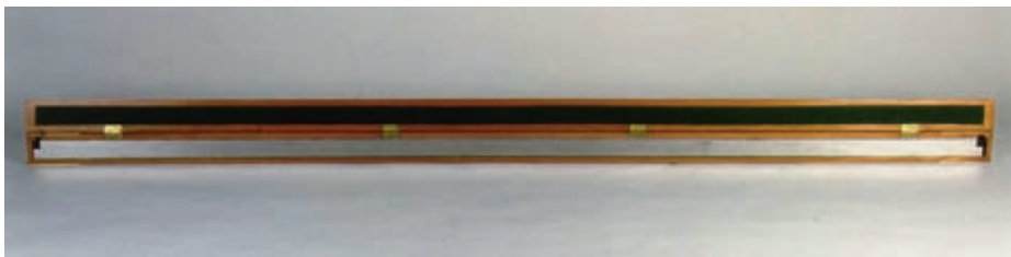
Reproducción de una toesa, antigua medida de longitud equivalente a 1,946 metros. Las toesas fueron utilizadas por los científicos de la medida del meridiano. (Museo Naval de Madrid).

jo de zapa, vadeo de barrancos, desbrozado, arranque de arbustos, etc. Las mediciones de la longitud exacta de dicha base comenzaron el 8 de octubre de 1736 y se prolongaron hasta el 5 de noviembre, con lo que obtuvieron la dimensión de uno de los lados del primer triángulo. En las cercanías de Cuenca se levantó otra línea terminal comprobatoria.