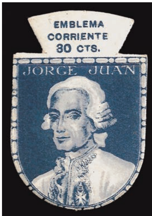
Retrato de Jorge Juan en un emblema antiguo.

Las instrucciones previas que recibieron los dos españoles, decían que «además de las observaciones que quedan expresadas y de las que en compañía de los académicos franceses deben practicar, ejecutarán en particular todas aquellas otras que les parezcan consecuentes y que puedan ser útiles para perfeccionar la Geografía y la Navegación». También recibieron otros encargos orientados a recoger información y a desarrollar diferentes trabajos por las zonas a recorrer o visitar, relacionados con botánica; planos de ciudades, puertos y fortificaciones; estado de las provincias, pueblos y lugares; fertilidad o