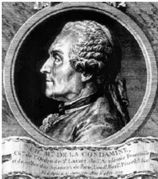
Retrato de La Condamine en un grabado de época.

Los expedicionarios también empezaron a sufrir las