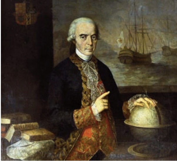
Retrato de Ulloa. (Museo Naval de Madrid).

diano que habían elegido y acababan de medir. Aquellas observaciones astronómicas habían empezado a finales del año 1738 y se prolongaron hasta 1740. Pero cuando en abril de 1740 parecía que ya estaban casi terminadas, aparecieron errores en las lecturas astronómicas por defectos de los instrumentos utilizados, por lo que decidieron repetirlas. Entre los instrumentos defectuosos se encontraba un observador cenital del Sol, en el que una larga estructura de unos 12