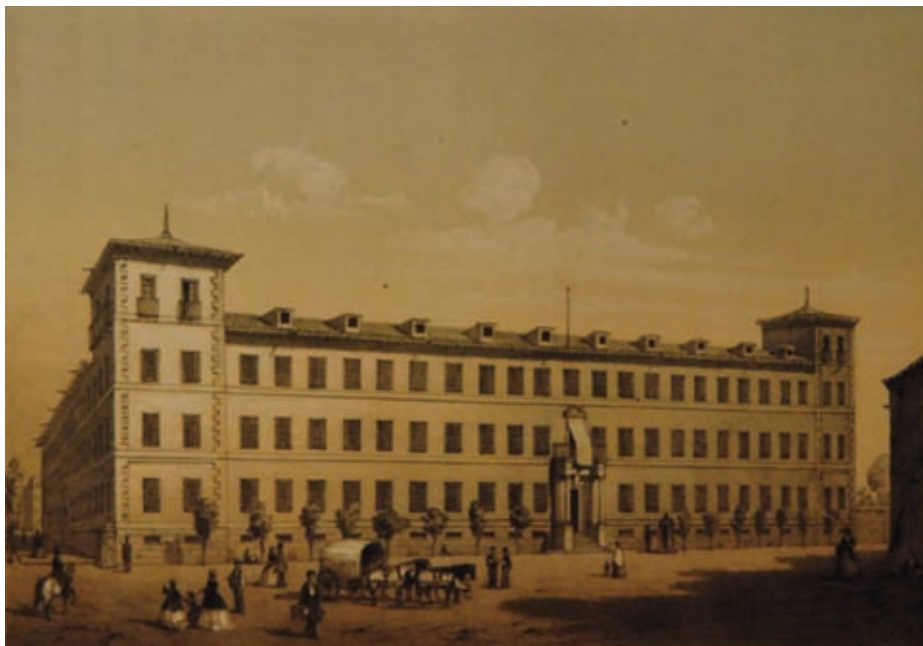
Real Seminario de Nobles de Madrid.

Por concesión real, recogida en el decreto de 9 de mayo de 1724, se concedieron al Seminario los derechos de la renta del tabaco, a lo que se añadían 2.000 doblones en oro para la obra, por tiempo limitado, que en 21 de noviembre de 1761, se amplió otros veinte años (43).