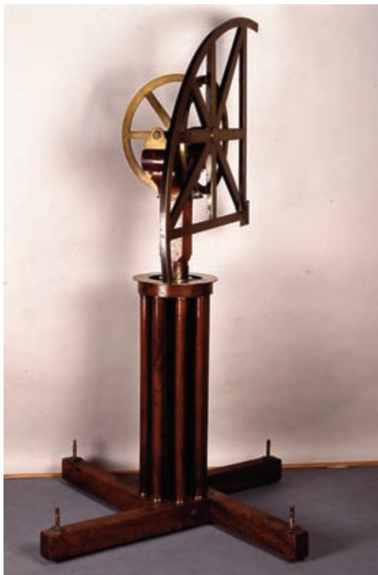
Cuadrante acimutal y de altura fabricado por John Bird en Londres, y utilizado por Jorge Juan y Ulloa.