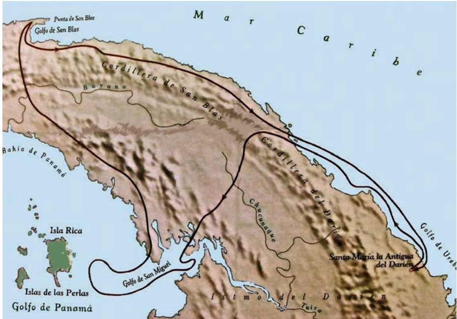
Ruta seguida por Balboa desde el Atlántico hasta el Pacífico.

De forma ordenada embarcaron en una pequeña flota, compuesta por un bergantín y nueve canoas, con la que costearon el Darién, navegando con el viento en contra, hasta llegar a Careta, en donde el cacique y medio suegro del capitán les recibió con cordialidad, garantizándole a Balboa la retaguardia en caso de cualquier adversidad. Allí se quedó la mitad de la tropa, unos cuantos marineros, al cuidado de las embarcaciones y de Anayansi.