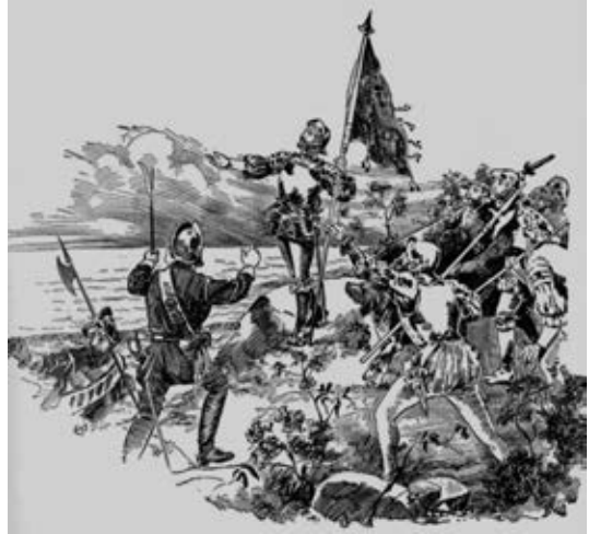
Vasco Núñez de Balboa toma posesión del Mar del Sur.

A la jornada siguiente, 24 de septiembre, tuvo noticia fidedigna de que desde la montaña que se levantaba ante los españoles podía divisarse el agua salada. Era la última barrera que tenía para llegar al Mar del Sur, hacia donde se dirigían solo sesenta y siete expedicionarios, pues el resto, un grupo de enfermos y extenuados, quedó esperando. Vasco Núñez de Balboa era consciente de que al otro lado del cerro viviría una jornada gloriosa. Muy temprano, apenas despuntó el primer rayo de sol, dio la orden de marcha y se reinició la ascensión, encabezando la misma