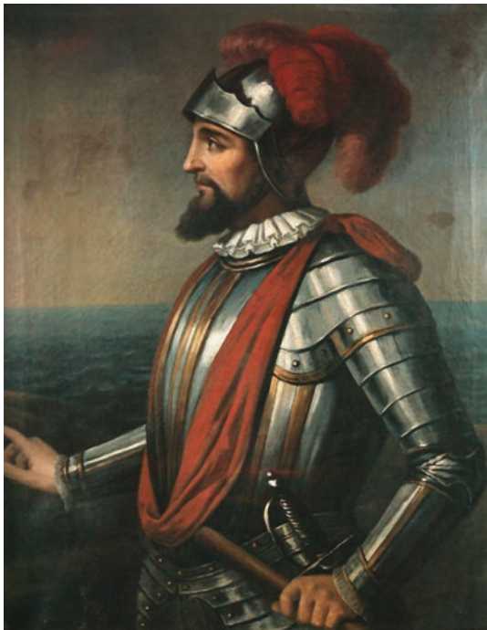
Vasco Núñez de Balboa.

de sus altezas en la su corte y en todos sus reinos é señoríos, que estuve presente é doy fe de ello; y digo que son por todos sesenta y siete hombres estos primeros cristianos que vieron la mar del Sur, con los cuales yo me hallé é cuento por uno de ellos. Y soy de San Martín de Valdeiglesias».