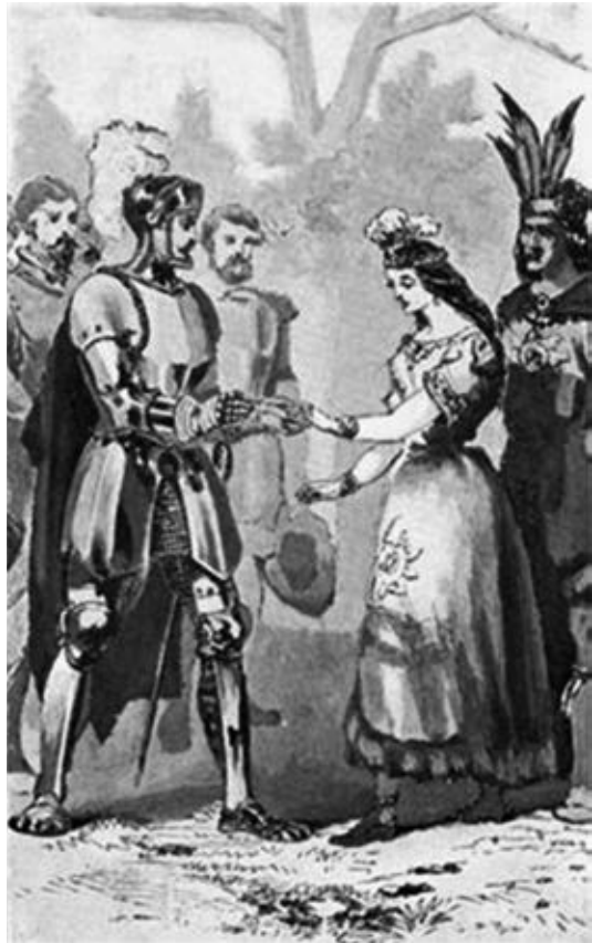
El cacique Careta entrega a su hija Anayansi a Balboa.

Vasco Núñez se convirtió en la máxima autoridad del