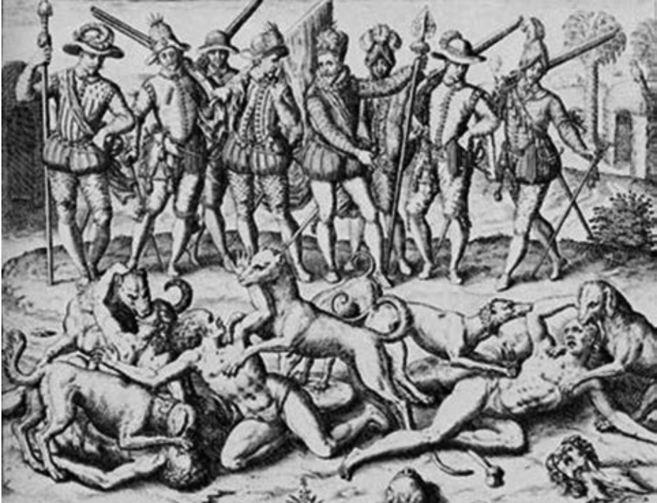
Los perros fueron grandes auxiliares en las peleas con los indios.

Pero con el primer barco que vino de España llegaron malas noticias. El bachiller Enciso había presentado ante la justicia una querrela contra Balboa, logrando que se le condenase a pagar una importante indemnización. Y la carta de 20 de enero no había llegado a la Corte.