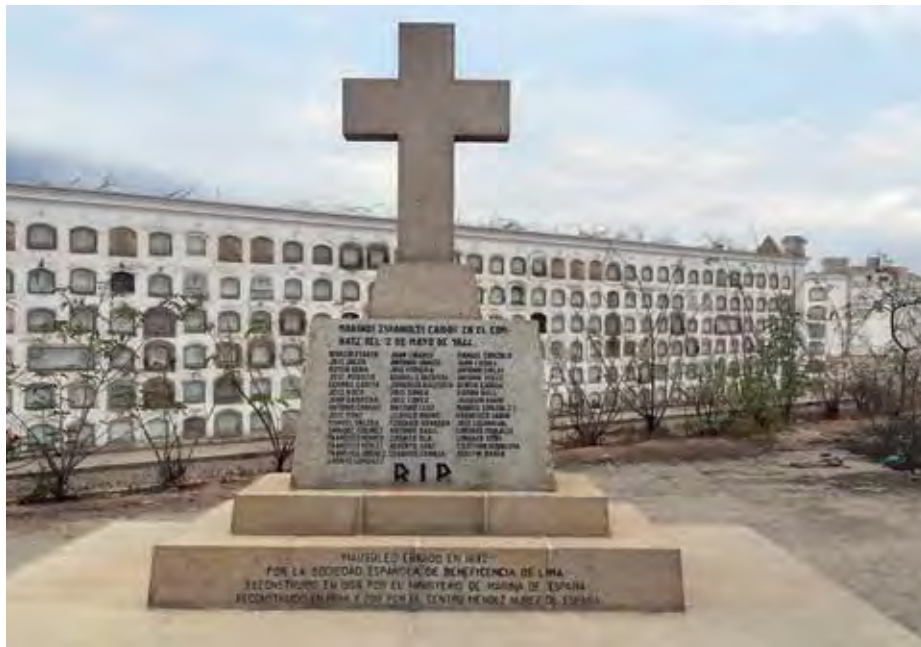
Detalle del monumento erigido en 1966, y en la base inferior, leyenda grabada en 2013 en sustitución de una de las tres placas robadas.

Ellos, el gobierno de la «dictadura suprema», gozaban de todas las ventajas tácticas, técnicas, logísticas y estratégicas, todo les favorecía, lugar, gentes, armamento superior... pues El Callao era el avanzado frente de una nación, y