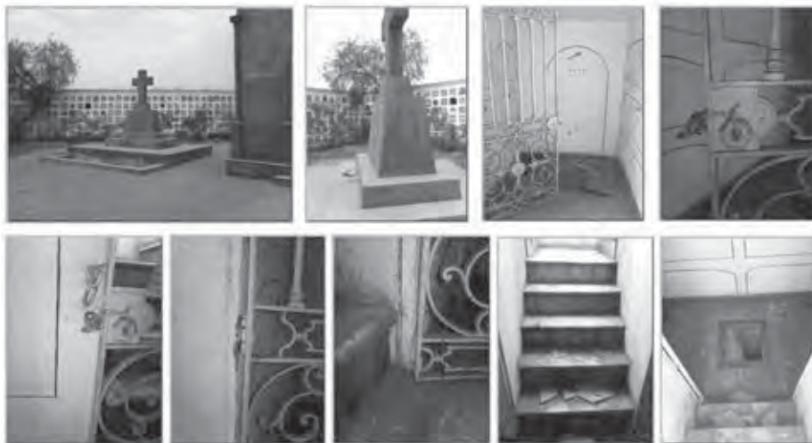
Algunos de los destrozos ocasionados en la tumba objeto de este trabajo.

El autor, hace casi un cuarto de siglo, cuando se documentaba para su primer libro editado en el Perú, entre archivos, bibliotecas, museos y otras fuentes correctoras de su ignorancia, descubrió en el Cementerio General de Lima, tras buscarlo con incontenido tesón, este enterramiento y, ante su vergonzante estado, se sintió forzado a repararlo a su costa... tras sufrir un