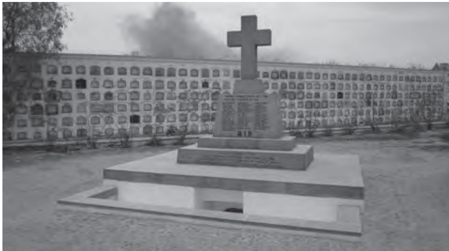
El mausoleo terminado, febrero 2013.

Además de las demostraciones en Lima, la Marina chilena escoltó, con otros barcos extranjeros, los restos; en la bahía del Callao había 28 lanchas. El orden de parada era: á la cabeza el Capitán del puerto; en el centro, la balandra conduciendo los restos y la comisión de Beneficencia de Lima; los oficiales de la Marina chilena y otras naciones, conduciendo las cintas de los fére-