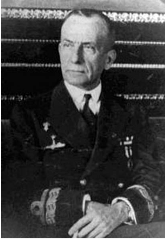
Almirante Mateo García de los Reyes.

que trataré de resumir para no resultar demasiado tedioso; dice que el creador —remarco la palabra porque me parece el meollo de la cuestión— del Arma Submarina española fue su antepasado el almirante Augusto Miranda Godoy, y no Mateo García de los Reyes, creencia generalizada esta última que le parece un error histórico. Esa opinión generalizada le lleva a hacer unas puntualizaciones «con el único propósito de sentar definitivamente las bases de la verdad histórica sobre el nacimiento del Arma Submarina».