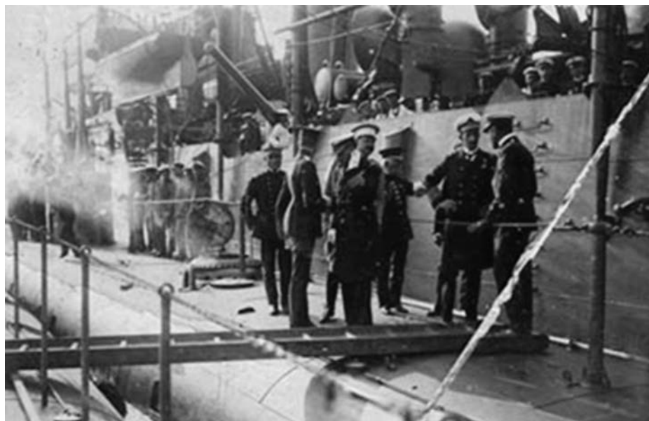
Visita de S. M. el rey Alfonso XIII a la Flotilla destacada en Santander.