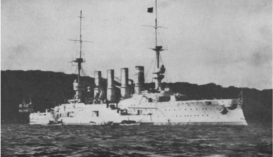
Crucero acorazado Gneisenau .