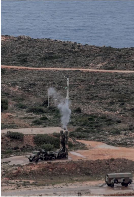
Disparo del sistema S-300 en el polígono NAMFI en Creta.

por la junta militar de Atenas en 1974, Turquía respondió con una invasión. El territorio en manos turcas se convirtió en la República Turca del Norte de Chipre, únicamente reconocida por Turquía, quedando la isla dividida desde entonces (Malinson, 2005: 75-87).