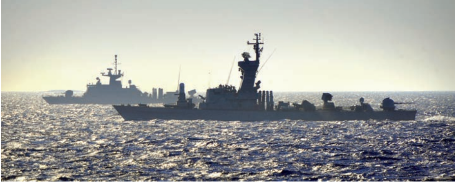
Corbeta israelí clase Sa'ar 4.5 y patrullera griega clase Roussen .

embargo, Rusia y Siria han firmado nuevos contratos de venta de armamentos (Grove, 2013). En la primera mitad de 2013, Siria recibió una versión avanzada del misil antibuque ruso Yajont (Gordon y Schmitt, 2013). Ese aumento de capacidades de Siria no pasó desapercibido y los depósitos militares que los albergaban cerca del puerto de Latakia fueron atacados el 5 de julio por la Fuerza Aérea o la Marina israelíes (Gordon, 2013). Otros contratos prevén la venta de 12 cazabombarderos MiG-29M2 y 36 entrenadores avanzados Yak-130 (Defense Industry Daily, 2014), aunque la exigencia rusa de pagos por adelantado refleja una perspectiva más cauta de Moscú sobre la supervivencia del régimen de Assad.