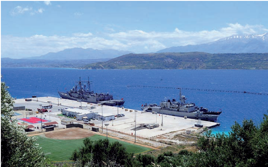
Vista de la bahía de Suda durante el ejercicio PHOENIX EXPRESS 2012.

Tras su entrada en la Organización del Tratado del Atlántico Norte en 1952, Grecia firmó un acuerdo, el 12 de octubre de 1953, para el establecimiento de bases militares estadounidenses en su territorio. La relación cercana con Estados Unidos fue un legado de la Guerra Civil griega, en la que su apoyo fue imprescindible para hacer frente al bando comunista apoyado por Albania, Bulgaria y Yugoslavia (Powaski, 2000:95-96). Las relaciones con la