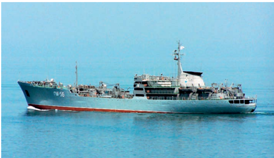
Buque taller PM-56 de la Flota rusa del Mar Negro.