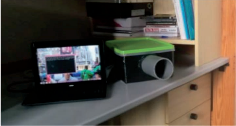
Imagen de uno de los prototipos recibiendo durante una prueba con los láseres (en la foto, el receptor estaba enfocado hacia el escritorio opuesto de la habitación, donde se encontraba el otro prototipo emitiendo).

de Fin de Grado (TFG) (1) el desarrollo de dos prototipos que permitiesen transmisiones y recepciones automatizadas por Scott entre dos lanchas de instrucción de la ENM.