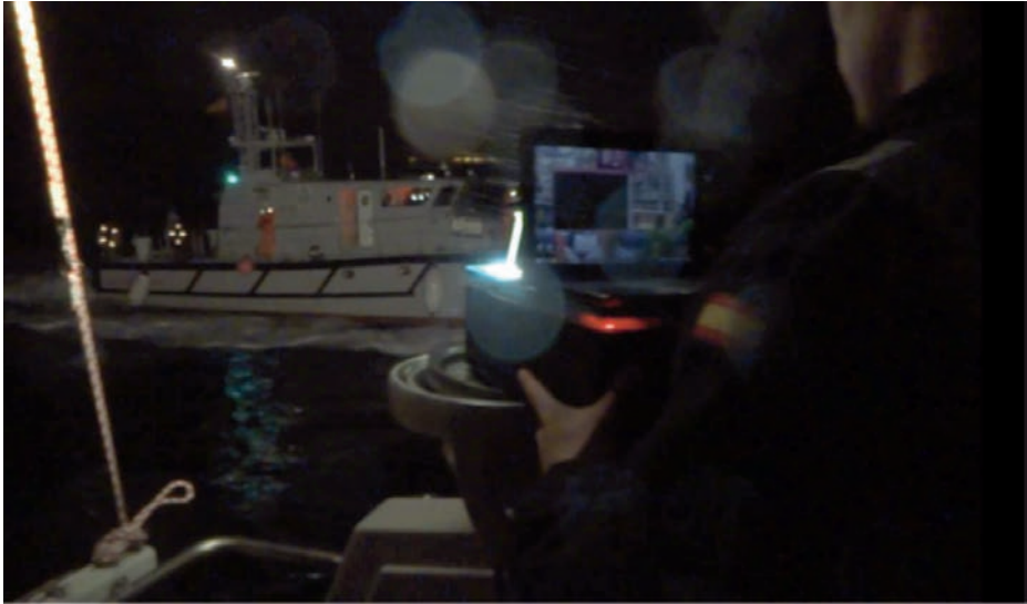
Imagen de las últimas horas de la prueba nocturna (se aprecia el prototipo emitiendo con el foco halógeno y el portátil con la ventana del ejecutable Putty abierta indicando el texto conforme se va transmitiendo).

ces de transmitir y recibir de manera automatizada por Scott, con un coste material por unidad inferior a 120 euros. Elaborado el código y fabricados los dos prototipos, los sometimos a distintas pruebas en tierra (transmitiendo con los láseres y los focos halógenos a distintas velocidades, a una distancia máxima de cincuenta metros) y una entre lanchas de instrucción navegando (con los focos halógenos a una distancia de entorno a cuarenta metros). De ellas obtuvimos valiosas conclusiones, como las ventajas de las transmisiones con emisores láseres respecto a las de los focos halógenos (mayor discreción y seguridad, mayores alcances con menor potencia requerida, etc.), aunque necesitan de una plataforma precisa que mantenga los prototipos estables y enfocados entre sí.