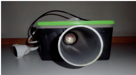
Imagen frontal de uno de los prototipos (a través del tubo tras la lupa se aprecia el fotorresistor).

convertido en un transmisor que no delate su posición. Pueden pensar que es imposible, pero creo que si aún no somos capaces de predecir el alcance que puedan llegar a tener estos sistemas es precisamente porque todavía no se han desarrollado lo suficiente. Aunque ahora sí sabemos que esta tecnología funciona y se puede implementar en barcos.