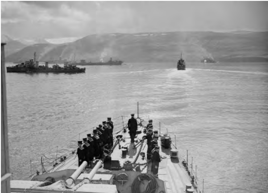
El PQ-17 en Hvalfiord.

El 27 de junio de 1942, el día previsto para hacerse a la mar, el PQ-17 se encontraba fondeado en Hvalfiord (Islandia). A las 13:00 horas locales, se celebró una conferencia para organizar el convoy en un edificio cerca de Hvalfiord. Esta conferencia estaba presidida por el contralmirante Hamilton, que tranquilizó a los asistentes explicándoles que el convoy iría protegido, además de por la escolta cercana que estaría a la vista, por otras dos fuerzas de cobertura lejana con cruceros y acorazados; además indicó que la RAF bombardearía los aeródromos de la Luftwaffe del norte de Noruega, y que creía que había muchas probabilidades de que el convoy llegara intacto a su destino.