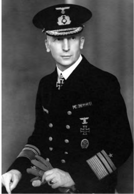
Schmundt en 1940, cuando era vicealmirante.

El día 1 de julio, poco después de las 14:30, un avión alemán Focke-Wulf 200 (FW-200) descubrió el convoy y transmitió el correspondiente informe a su base en Noruega. A partir de ese momento, los escoltas rompieron el silencio radio y el C. F. Broome informó a Whitehall del avistamiento del avión. El primer U-boot que avistó el convoy fue el U-456 —Kptlt. (5) Max-