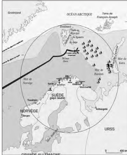
Dispersión del convoy PQ-17. Mapa 1942-fr. (Autor: Historicair). (Foto: www.wikipedia.org ).

Denning, horrorizado a la vista del mensaje, informó a su jefe inmediato, capitán de navío Clayton, el cual se lo comunicó enseguida a Pound, que contestó que «ya se había decidido dispersar el convoy, y que las cosas debían continuar así». Parece ser que Pound había telefoneado a Churchill, a quien tenía un cierto temor reverencial, informándole de sus intenciones. Tovey, que ya había tenido sus diferencias con el First Sea Lord a causa de las instrucciones del Almirantazgo transmitidas el 27 de junio, consideró inaceptables los últimos mensajes de Pound y posteriormente escribió que la orden de dispersión había sido prematura. La suerte estaba echada.