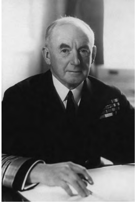
Almirante Sir Dudley Pound (First Sea Lord).

Poco después de esta conversación llegó un mensaje al London , insignia de Hamilton, así como al Duke of York , insignia de Tovey, situado varios cientos de millas al oeste: