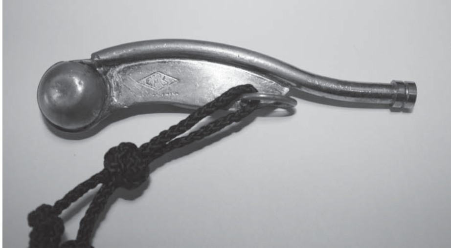
Chifle modelo español.

clases de marinería. Recibe del oficial de guardia sus órdenes, normalmente en forma oral, para después transmitir las en forma de código auditivo no verbal, mediante pitadas con el chifle, según un código sonoro conocido por todos.