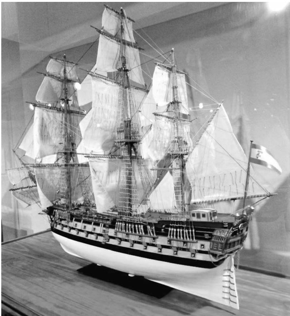
Navío San Ildefonso .