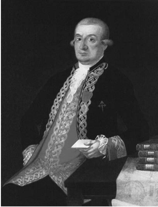
José Joaquín Romero de Landa. (Foto: Museo Naval).

hechos a la corona, por su amor a los Soberanos, por su zelo, desinterés e incesante aplicación al desempeño de sus obligaciones, ha merecido siempre la confianza de los Reyes y de sus ministros y la estimación del público. (Gaceta de Madrid, 1807: 970).