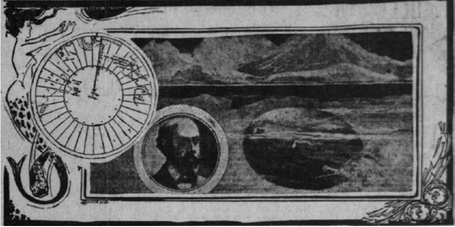
Precioso grabado que representa al submarino y a su creador, contenido en el periódico The San Francisco Call , de 15 de abril de 1902.