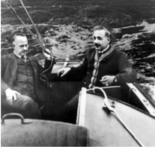
Einstein y Anschütz-Kämpfe disfrutando de una tarde de navegación en Kiel.

comentarios de aquellos que comparaban su expedición con la del desaparecido aeronauta sueco Salomon August Andrée (5), muy reciente en la memoria de la mayoría de los cafés y de las columnas de los diarios. Ni siquiera el peligro del empleo de la dinamita para abrir boquetes en el hielo le quitaba el sueño. El mayor quebradero de cabeza de Anschütz-Kämpfe fue crear un aparato que pudiera servirle para orientarse en las profundidades y que no se viera afectado por los materiales metálicos de la propia nave. Mientras estudiaba el problema, a Anschütz-Kämpfe le llamó la