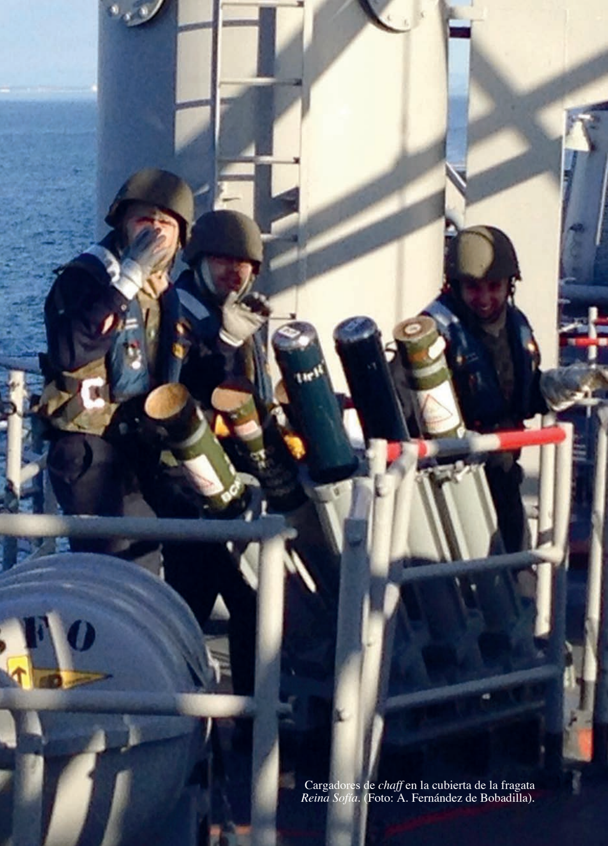
Cargadores de chaff en la cubierta de la fragata Reina Sofía .