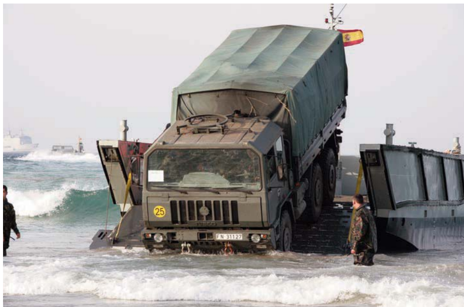
Desembarco de un camión durante el ejercicio TAPON 07.

La desagregación conlleva que una fuerza anfibia se divida en grupos más pequeños y geográficamente dispersos, llegando incluso a poder estar algunos de ellos completamente aislados.