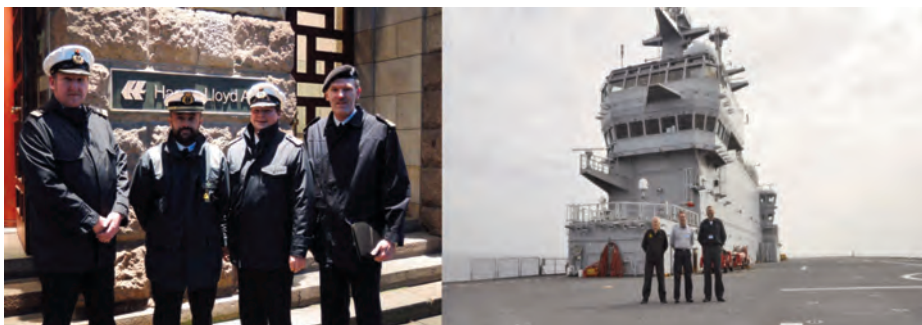
Primera activación internacional de reservistas voluntarios NCAGS visitando la sede de la Hapag-Lloyd en Hamburgo durante el DYMR 16 y embarcados a bordo del FS Tonnerre durante las TRJT 16.