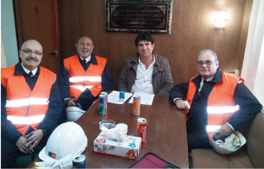
Equipo de briefings (todos ellos reservistas voluntarios) con el capitán del M/VAPUS, dedicado al transporte de ganado vivo, durante su escala en Cartagena.