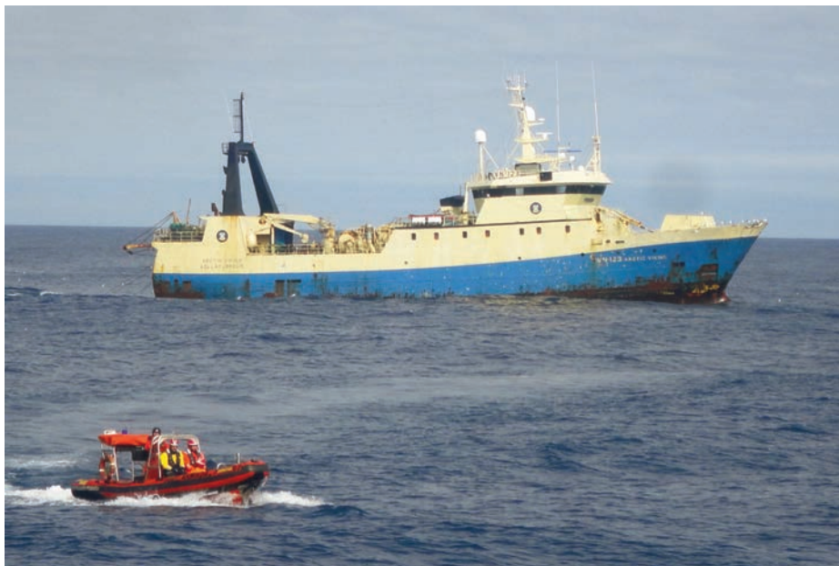
Inspección a un pesquero durante la Campaña NAFO.