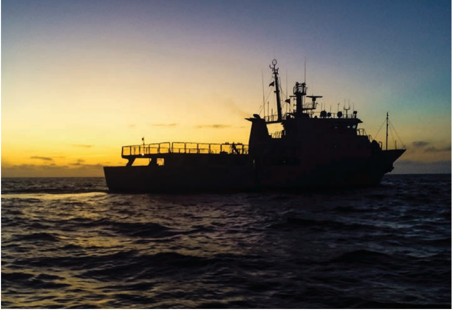
Navegando al ocaso.

viento para que el arriado de la embarcación y el embarque y desembarque de personal se realice con seguridad, lo que se complica bastante cuando la mar de fondo y la de viento vienen de direcciones diferentes. Este posicionamiento tiene que ser compatible con que la embarcación realice el tránsito hasta el pesquero con la mar favorable, de modo que el equipo de inspección no se moje durante el traslado, ya que posteriormente van a trabajar en la bodega a muy baja temperatura.