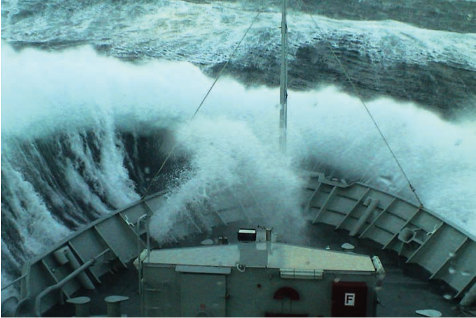
El Arnomendi capeando un temporal en alta mar. (Foto: www.flickr.com/photos/armadamde/ ).