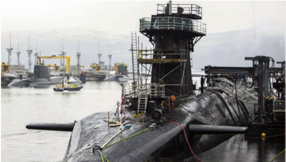
Submarino nuclear HMS Vigilant atracado en la HMNB Clyde.

Concretamente, el sector naval británico sería uno de los más afectados en esta posible independencia, ya que los astilleros escoceses son los responsables de llevar a cabo los grandes programas navales del Reino Unido, como