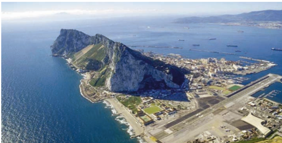
Vista aérea de Gibraltar.

Para lograr este acuerdo bilateral, el jefe de la diplomacia española remitió una misiva a sus 26 homólogos de la UE (todos, menos el británico) y a los presidentes de las instituciones europeas (Consejo, Comisión y Parlamento) en septiembre de 2016, en la que les pedía su apoyo para que la cuestión de Gibraltar se excluya de la negociación del nuevo marco de relaciones entre la UE y Reino Unido, con el argumento de que debe resolverse en conversacio-