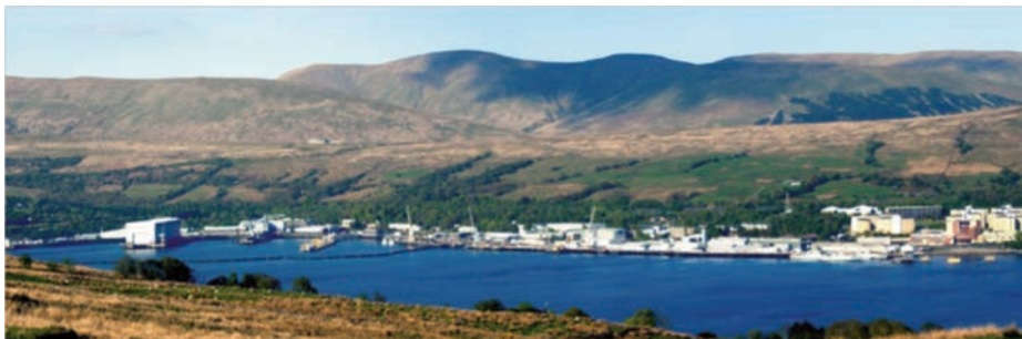
HMNB Clyde. Faslane, Escocia.

Es factible que, tras una hipotética independencia de Escocia, se pudieran reubicar gran parte de las unidades y capacidades del Reino Unido dentro del territorio de Inglaterra, Gales o Irlanda del Norte; pero la que presentaría mayor dificultad sería la alternativa a la Base Naval de Clyde, que alberga a