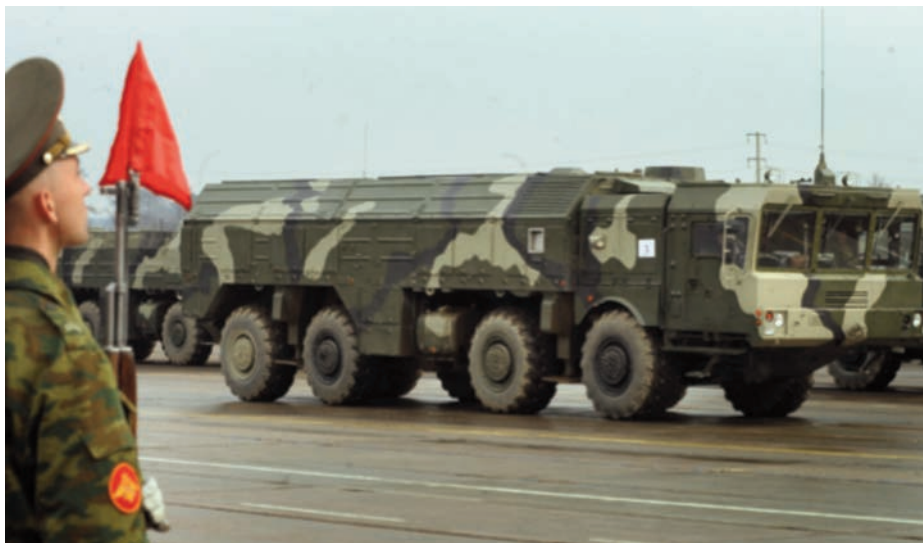
Despliegue militar en Kaliningrado.