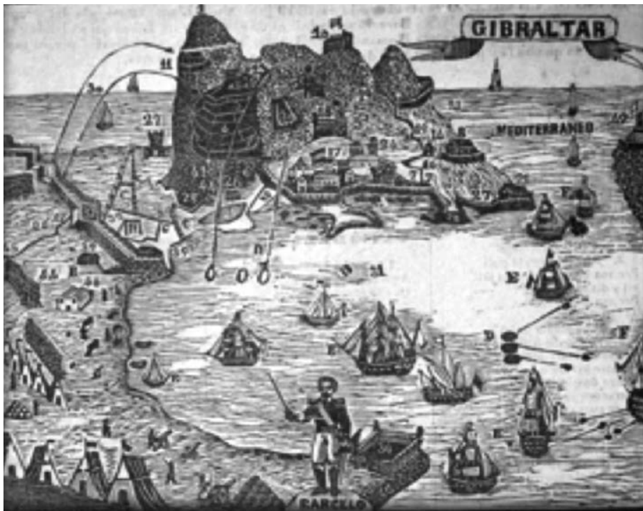
Gibraltar durante el sitio de 1779. Imprenta de Campins y Pont, Barcelona 1849.

Como nos decía el almirante y polígrafo Julio F. Guillén Tato: «Gibraltar es el punto neurálgico de nuestra historia y el lugar más dolorido de nuestras costas benditas». Desde 1704 el problema de Gibraltar es el gran problema para cualquier marino, con tantas medidas claras y precisas por parte de España a través de tantos años como ninguna por parte de Reino Unido.