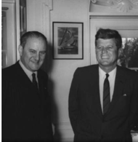
El autor del Libro Rojo, Fernando María Castiella, con el presidente de los Estados Unidos John F. Kennedy.

El Libro Rojo de Fernando María Castiella, por aquel entonces ministro de Asuntos Exteriores, causó un impacto tremendamente efectivo en todo el mundo. Se iniciaba con una breve referencia a la conquista del Peñón por los ingleses en 1704, continuaba con las limitaciones del célebre artículo X del Tratado de Utrecht, las limitaciones terri-