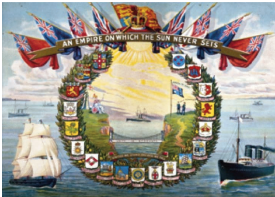
Los restos del Imperio: An Empire on which the Sun Never Sets . (Fuente: Prince Albert Museum).