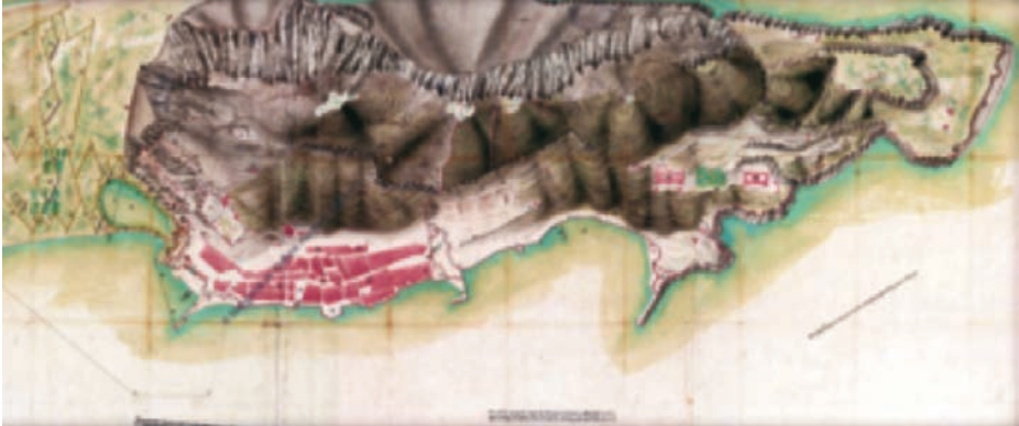
Plano de la plaza de Gibraltar, obra de Juan Cavallero, San Roque 1779. (MPD, 02, 065).