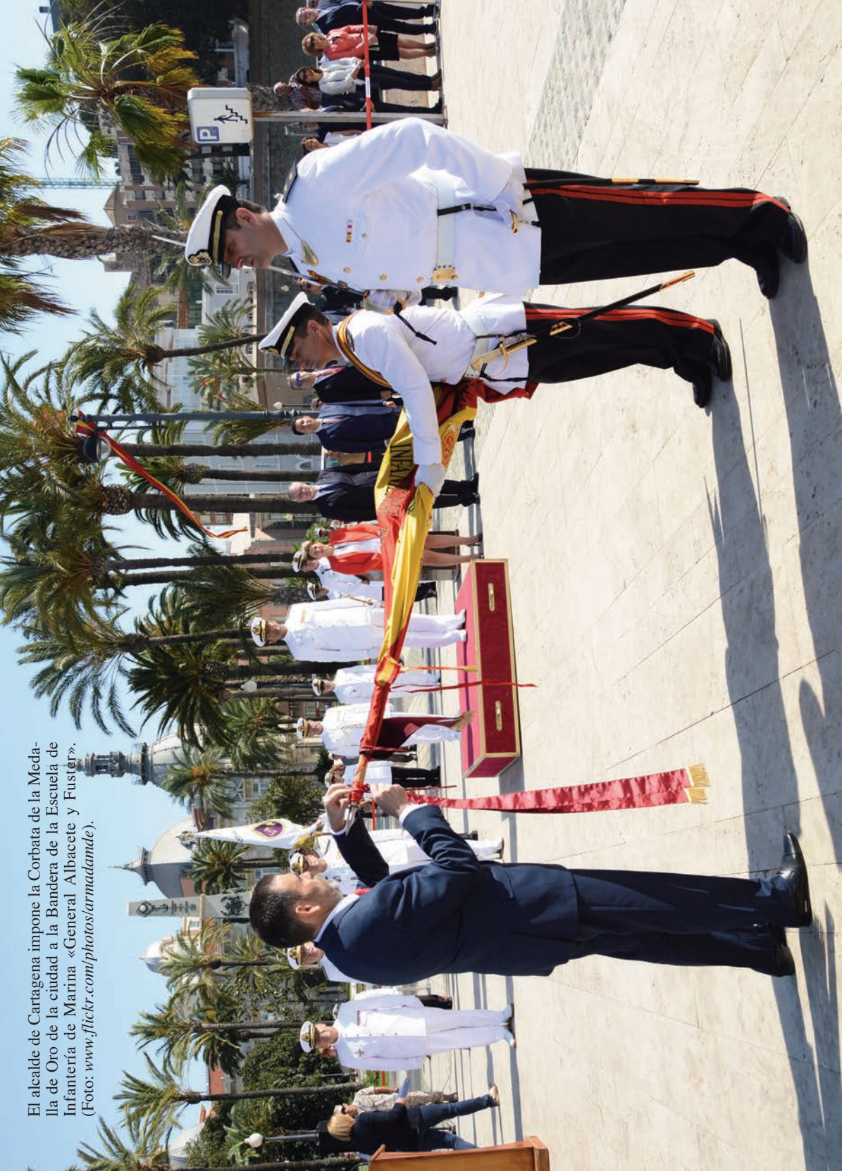
El alcalde de Cartagena impone la Corbata de la Medalla de Oro de la ciudad a la Bandera de la Escuela de Infantería de Marina «General Albacete y Fuster». (Foto: www.flickr.com/photos/armadamde/ ).