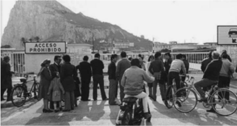
Cierre de la Verja en los años sesenta.

En 2001 España y el Reino Unido anunciaron un acuerdo preliminar que incluía una propuesta de cosoberanía (15). Sin embargo, no llegó a ser firmado (16), especialmente al ser ampliamente rechazado por los gibraltareños en un nuevo referéndum en 2002 que obtuvo el 98,48 por 100 a favor de mantener sus vínculos con Reino Unido (17).