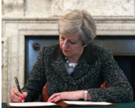
Carta de Teresa May al presidente del Consejo de la UE, Donald Tusk, invocando la aplicación del artículo 50 que inicia la salida del Reino Unido.

La salida del Reino Unido, y por tanto de Gibraltar, de la UE se formalizó el pasado miércoles 31 de marzo de 2017 con la firma de la Carta por la primera ministra británica Teresa May (Morillas, Brown, Prelec, Dhingra y Oliver, 2016), invocando el artículo 50 del Tratado de la UE (22) (TUE), más conocido como Tratado de Lisboa, que recoge el derecho de los estados miembros a abandonar el bloque comunitario y establece unas normas mínimas para ello (23).