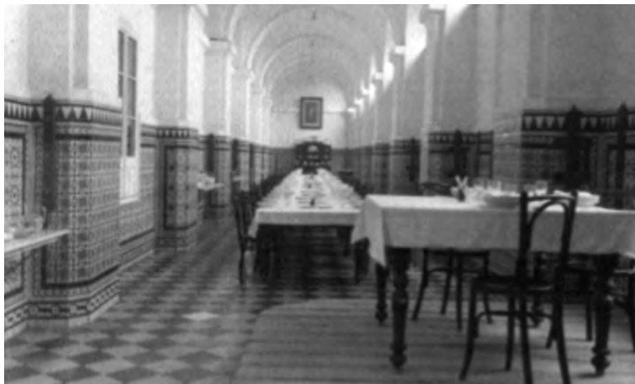
Comedor de la Escuela Naval de San Fernando. Edificio Carlos III.

cularidad de reservar seis para cabos de primera, maestros y Cuerpos Auxiliares, es decir lo que hoy llamamos promoción interna (38). En 1936, y debido al inicio de la Guerra Civil (39), no ingresan los opositores que habían obtenido plaza. No es hasta 1938 cuando se vuelven a convocar oposiciones (40), dirigidas exclusivamente a personal embarcado en la Marina nacional menor de 25 años. Al ingresar tras pasar un curso preparatorio de seis meses eran nombrados guardiamarinas (41).