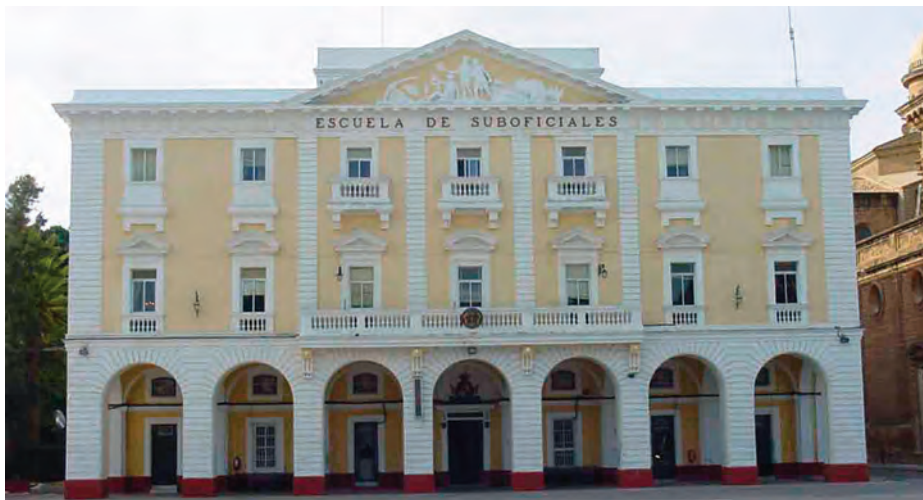
Escuela de Suboficiales.

A mediados de 1938 el Gobierno Provisional ya había empezado a pensar en su traslado a Marín, lo que disparó la preocupación en San Fernando. Para intentar convencer al Gobierno, el 20 de septiembre de 1938 salió para Burgos una comisión del Ayuntamiento de San Fernando. Esta iniciativa municipal no tuvo éxito, pues al término de la contienda se comenzaron los trabajos en la que fue Escuela de Tiro Naval y hoy Escuela Naval Militar en Marín.