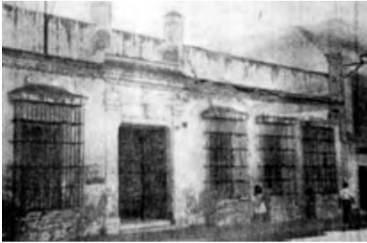
Una de las pocas fotografías de la Casa de Reyna antes de su derribo.

Cuando se traslada la Real Compañía a la Villa de la Real Isla de León, aún no habían empezado las obras del ambicioso proyecto de la Población Militar de San Carlos. Este se había iniciado en 1766, siendo ministro de Marina Pedro González Castejón y Salazar «con el objeto de establecer en ella el Departamento de Marina con más comodidad del Real Servicio, e inmediatez al Arsenal de la Carraca». Su primer arquitecto