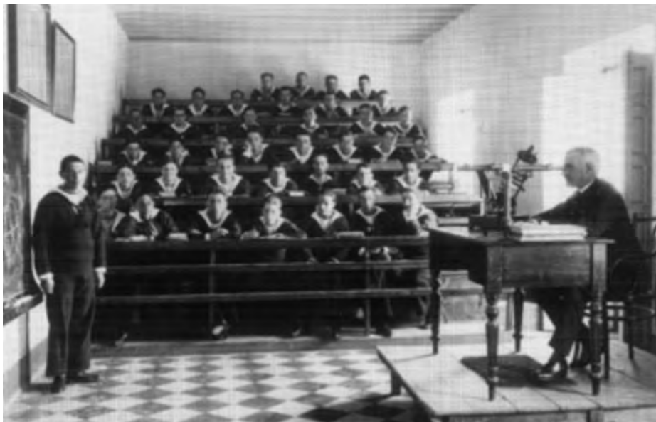
Aspirantes en clase a principios del siglo xx.

Fortificación y Dibujo de la Academia (15). Estas obras nunca se llevaron a cabo, ya que la idea predominante era que todos los efectivos militares, incluida la Real Compañía de Guardiamarinas, estuviesen en la proyectada Población Militar de San Carlos. En 1791 tenemos el testimonio del viajero Antonio Ponz (16): «Actualmente, reside aquí y tiene una razonable biblioteca, una sala de armas y otras muchas cosas para el conocimiento e instrucción de su ejercicio mariner... El colegio de los Guardias Marinas se trasladó de Cádiz a esta Villa y permanecerá hasta que se haya concluido la nueva población de San Carlos, que se está construyendo, a donde se han de trasladar». Sin embargo, este ansiado traslado tuvo que esperar hasta 1845, como ya veremos.