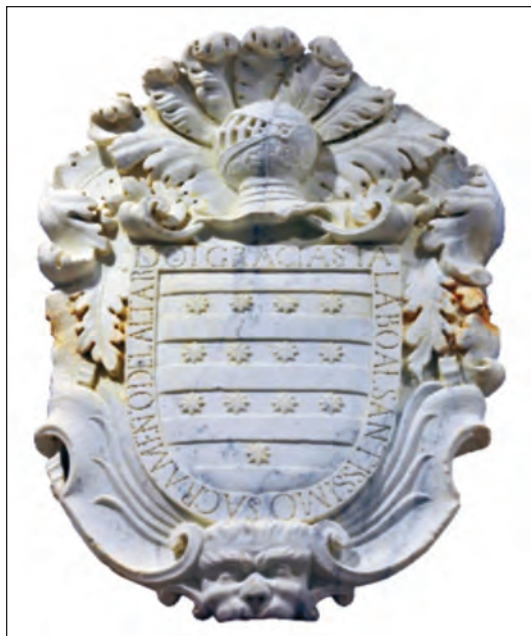
Escudo de la familia Barrios en la Casa del Sacramento, actualmente en el Museo Naval de San Fernando.

En julio de 1770 se le oferta al citado marqués la compra de más terrenos aledaños. Esta operación tenía como objetivo construir otro edificio y concentrar así la Academia y el Cuartel, dado el ya conocido mal estado de la Casa de Reyna. El proyecto fue realizado por el capitán de Infantería Tomás Canelas de la Torre, que era a la sazón profesor de