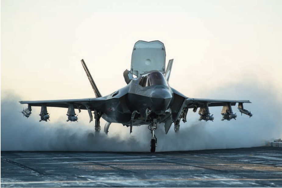
F-35B , con armas en las estaciones externas, a bordo del LHA America , el 3 de noviembre de 2016. (Foto: Lockheed Martin, https://www.flickr.com/photos/lockheedmartin ).