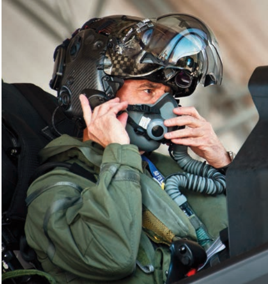
El general de división Jay Silveria, comandante del Centro de Guerra Aérea de la USAF, en la cabina de un F-35A antes de un vuelo. Se puede apreciar el especial diseño del casco.