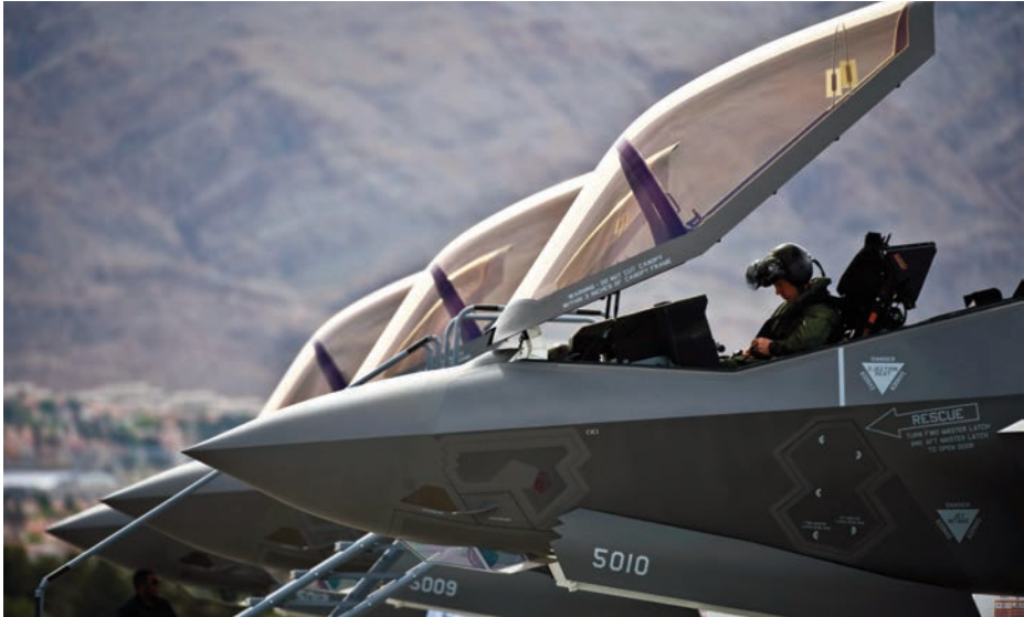
Aviones F-35A en la línea de vuelo de la Base Aérea de Nellis. (Foto: USAF, autor Senior Airman Brett Clashman).