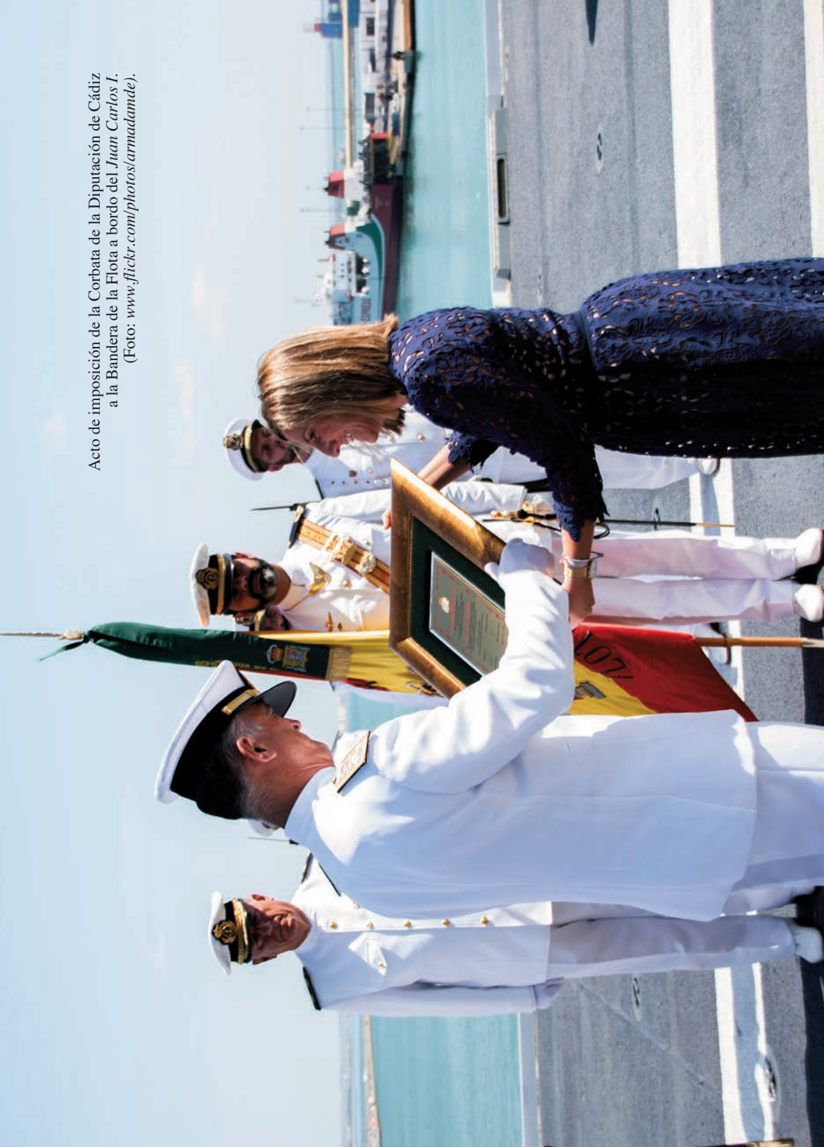
Acto de imposición de la Corbata de la Diputación de Cádiz a la Bandera de la Flota a bordo del Juan Carlos I . (Foto: www.flickr.com/photos/armadamde ).