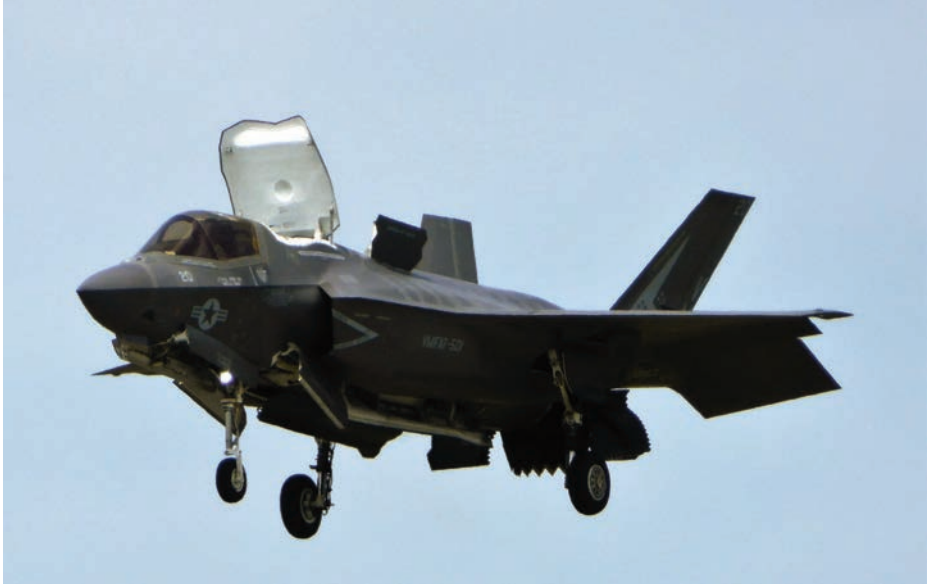
F-35B realizando un estacionario en la Estación Aérea de Infantería de Marina de Beaufort, Carolina del Sur.