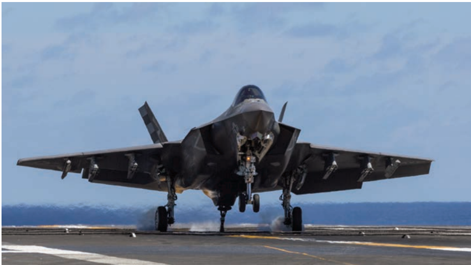
F-35C del Escuadrón VX-23 tomando a bordo del portaviones George Washington el 14 de agosto de 2016. (Foto: Lockheed Martin, https://www.flickr.com/photos/lockheedmartin ).

A pesar de los retrasos, sobrecostes y deficiencias que ha sufrido el programa F-35 , este avión de quinta generación ha comenzado a entrar en servicio y ya ha realizado sus primeros despliegues. Constituye un éxito de cooperación multinacional y dentro de pocos años se convertirá en el principal avión de