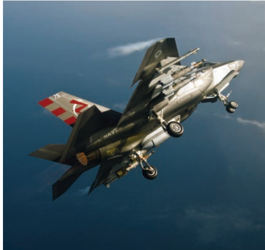
F-35C en vuelo sobre la costa de Maryland, el 26 de junio de 2015.

producción en serie. Durante el desarrollo se le han realizado exámenes exhaustivos, que continúan en la actualidad. El F-35B efectuó sus pruebas en la mar a bordo del LHD Wasp (2011 y 2015) y del LHA America (2016). Las del F-35C se llevaron a cabo en los portaviones Nimitz (2014), Dwight D. Eisenhower (2015) y George Washington (2016). El programa fue reestructurado en tres ocasiones (2003, 2007 y 2012) por retrasos y sobrecostes debidos al solape entre desarrollo, pruebas y producción, que además implica la actualización de aviones ya en servicio.