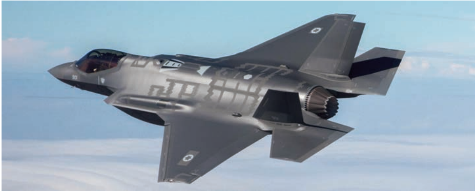
F-35I Adir de la Fuerza Aérea de Israel.