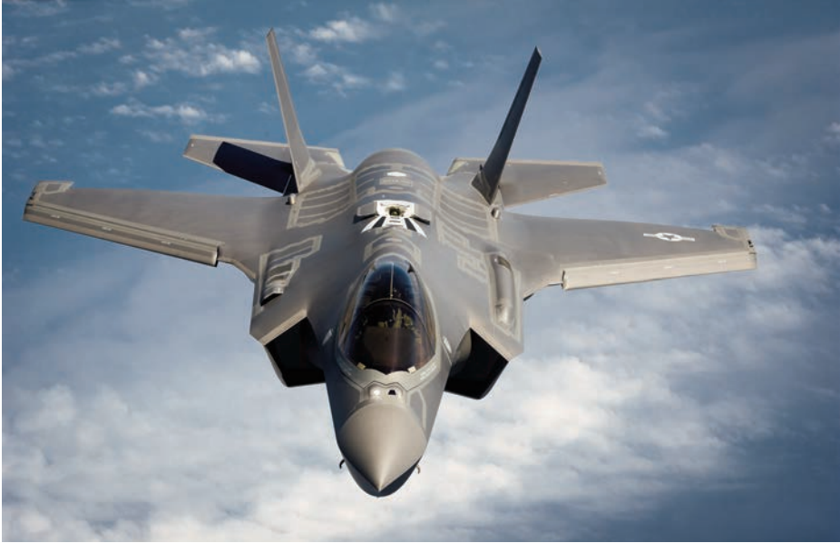
F-35A. (Foto: USAF, autor MSgt. John Nimmo Sr.).

más de una década. Aunque el programa de desarrollo del F-35 ha sido controvertido, tanto por algunas de sus características como por su coste económico, lo cierto es que finalmente se ha conseguido un avión de combate con excelentes prestaciones, cuyo precio se ha reducido progresivamente y que en un futuro cercano estará muy extendido por cuatro continentes.