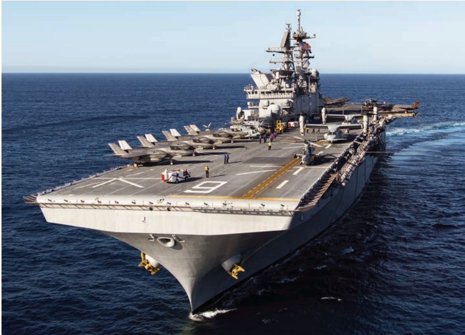
El USS America el 18 de noviembre de 2016, navegando en aguas próximas a California durante la realización de pruebas con aviones F-35B y aeronaves MV-22B . (Foto: Lockheed Martin, https://www.flickr.com/photos/lockheedmartin ).

IRAQUI FREEDOM en 2003. Al ser las características del F-35B muy similares a las del F-35C que embarcará en los portaviones, la unidad aérea de los LHA podrá tomar parte no solo en las operaciones anfibas, sino en cualquier misión de la fuerza naval, incluido el ataque a blancos estratégicos. El embarque de cuatro MV-22B configurables como cisternas (15) incrementará el radio de acción de los F-35B y su seguridad en vuelo.