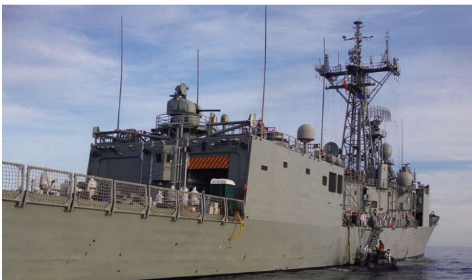
La fragata Santa María rescata una embarcación durante la Operación SOPHIA.

La Misión MARE SICURO también opera en el Mediterráneo Central y en las proximidades de Libia. Es una iniciativa italiana que comenzó en marzo de