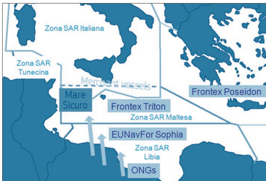
Figura 3. Misiones y zonas de operaciones en el Mediterráneo Central y Oriental. (European Political Strategy Centre, 2017)

2015 con un dispositivo aeronáutico de vigilancia y seguridad marítima, pero que a los pocos meses incorporó a los buques de la Marina Militar italiana. Su objetivo está orientado en cuatro vertientes: la protección de tráfico marítimo comercial; la lucha contra el terrorismo y todo tipo de tráfico ilícitos, incluyendo el de seres humanos; la protección de la flota pesquera y de los intereses petroleros italianos.