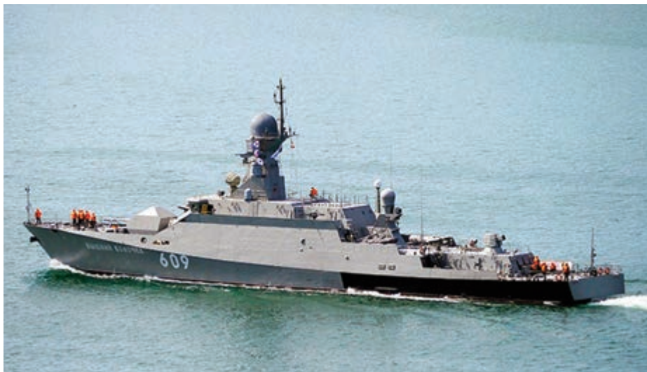
Corbeta Vyshny Volochok , armada con misiles Kalibr, desplegada en agosto de 2018 frente a las costas sirias.