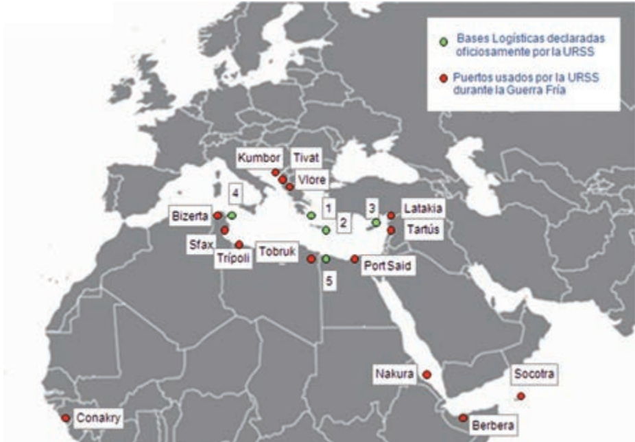
Figura 1. Bases navales usadas por la URSS en el Mediterráneo durante la Guerra Fría. (Elaboración del autor).

Quinta Escuadra, como hoy en día lo sigue demostrando el interés ruso en Siria. No obstante y según Rusia, en 1973 llegó a contar con cinco bases logísticas plenamente operativas en el Mediterráneo (figura 1): una en la isla de Citera en el mar Jónico, otras instalaciones en el este de Creta, en el noroeste de Chipre, en el puerto de Hammamet en Túnez y también en el de Sollum, en Marsa Matruh, en Egipto. Pero la realidad es que las capacidades navales y los apoyos terrestres nunca fueron equiparables a los disponibles por Estados Unidos. Otros puertos fueron utilizados eventualmente por la URSS (señalados en rojo en la figura 1).