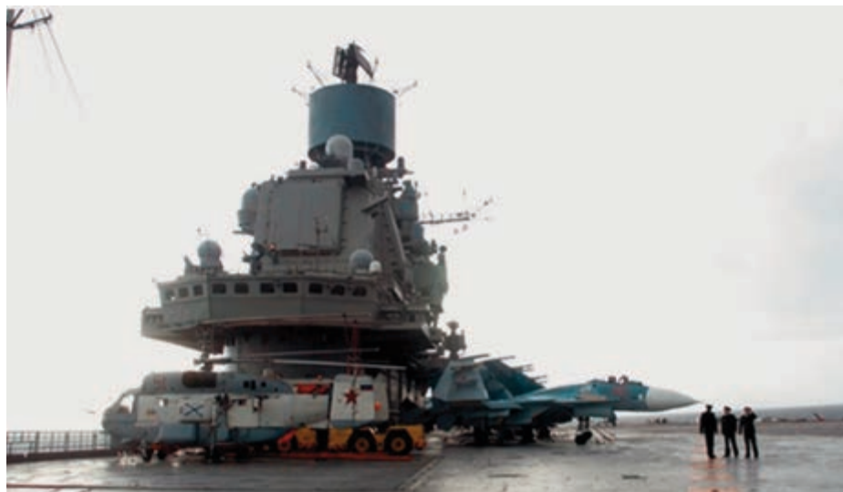
El portaviones Almirante Kuznetsov atracado en el puerto de Tartús.

En junio de 2017, el Ministerio de Defensa ruso informó sobre los medios navales desplegados en Siria para demostrar su poder naval. Según la comunicación oficial, los medios estaban formados por 15 buques de guerra y otras embarcaciones auxiliares. Siguiendo la misma línea informativa, en agosto de 2018 Rusia acusó a Estados Unidos de concentrar sus fuerzas navales en las proximidades de Siria. El Pentágono comunicó oficialmente que las declaraciones rusas no eran más que propaganda. Mientras tanto, Izvestia hacía público que se estaban desplazando a la zona diez barcos de superficie pertenecientes a la Flota del Mar Negro, armados con misiles de crucero de largo alcance tipo Kalibr y dos submarinos. Al mismo tiempo un portavoz de OTAN, buscando la distensión, declaraba que todos los actores en la región debían tener moderación y abstenerse de empeorar una situación humanitaria ya desastrosa en Siria. La información pública de la Federación Rusa, haciendo uso de Izvestia , la Agencia TASS y otros recursos informativos, continuó reforzando la idea de su potencial naval en el Mediterráneo. Así se resaltaba la realización de ejercicios navales: el crucero Mariscal Ustinov y el destructor antisubmarino Severomorsk con base en el mar de Norte participaron en las maniobras en el mar Báltico de julio de 2018, desplazándose después hasta Argelia.